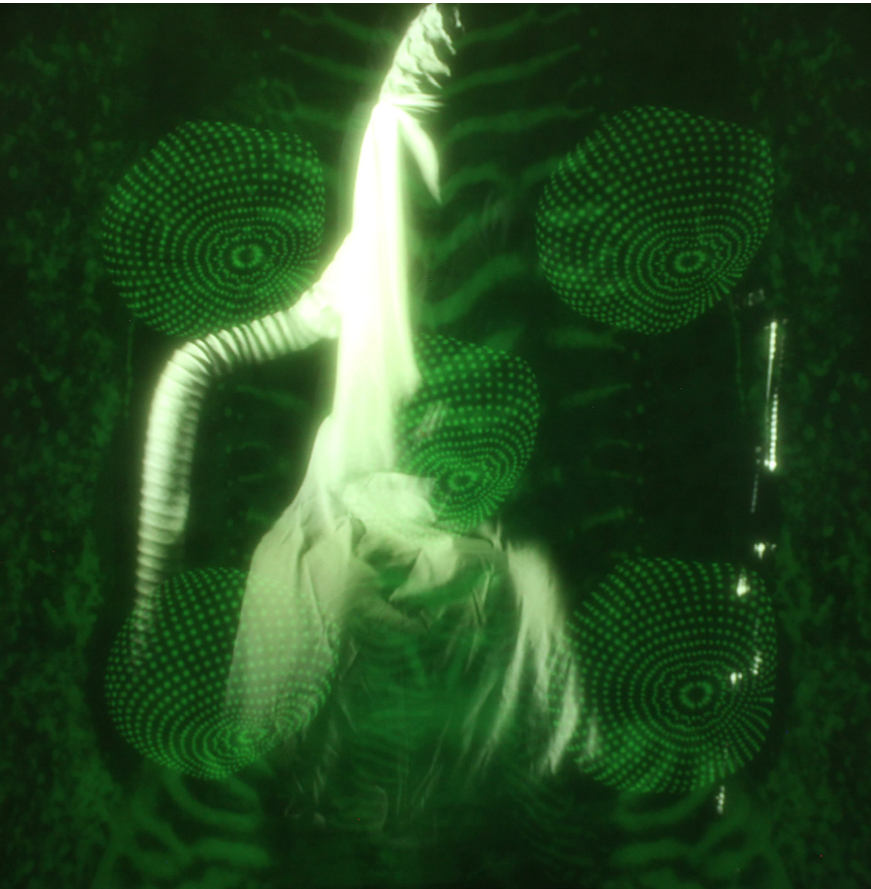
Duo Marswalkers, Noctiluca Scintillans , 2017.