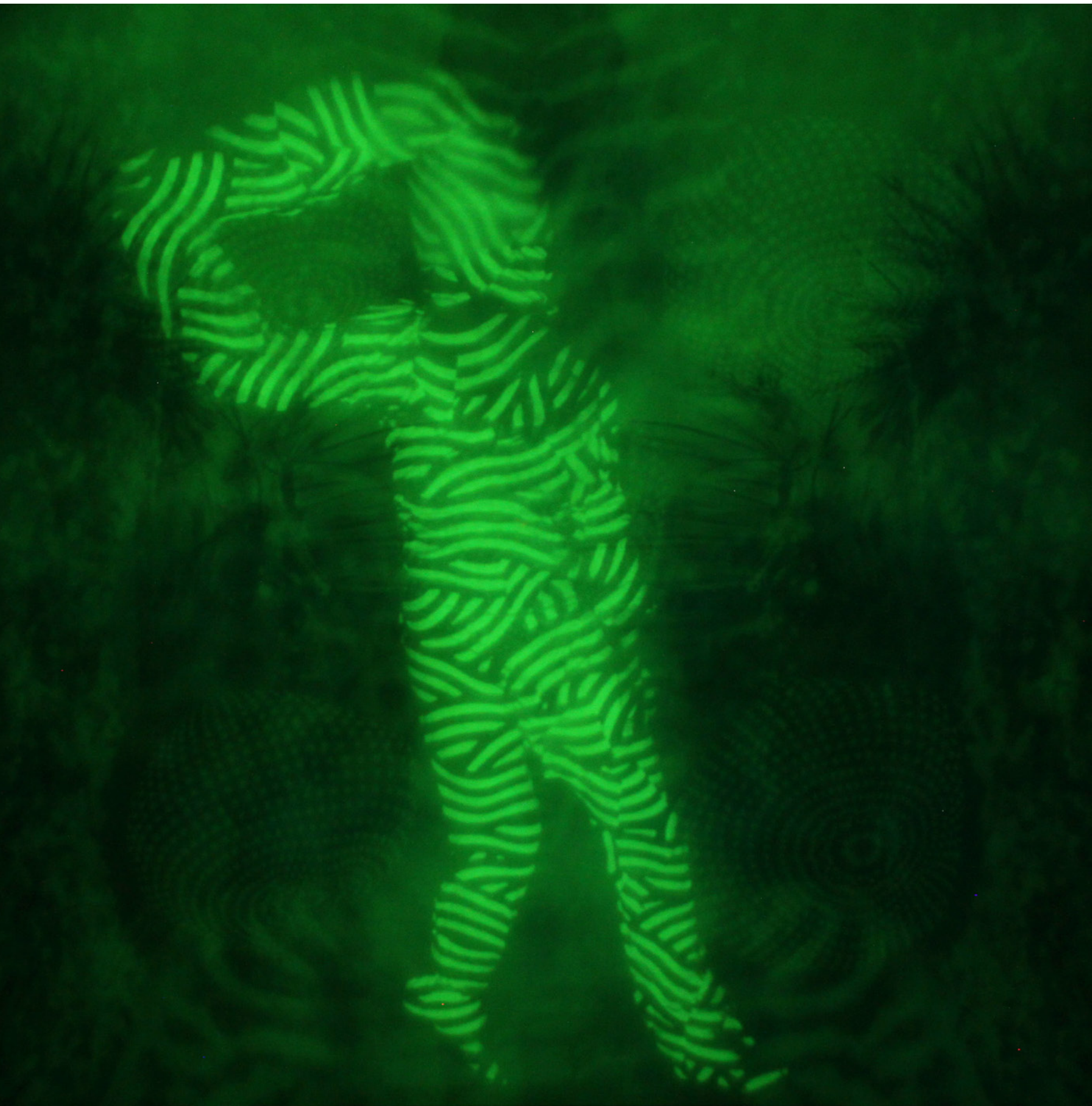
Duo Marswalkers, Noctiluca Scintillans , 2017.