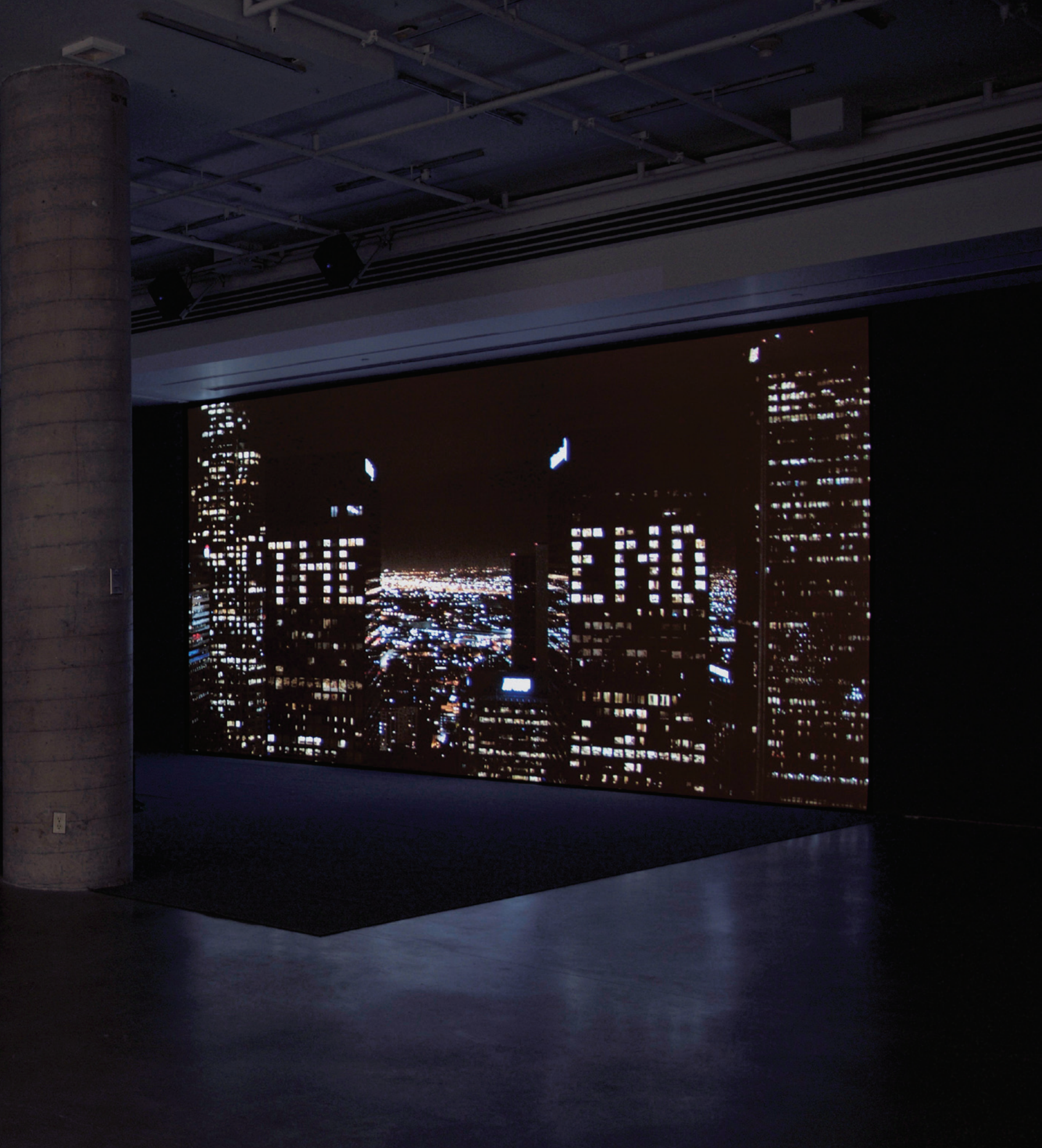
Aude Moreau, La nuit politique , 2015. Avec l'aimable autorisation de la Galerie Antoine Ertaskiran, Montréal. Photo: Galerie de l'UQÀM.