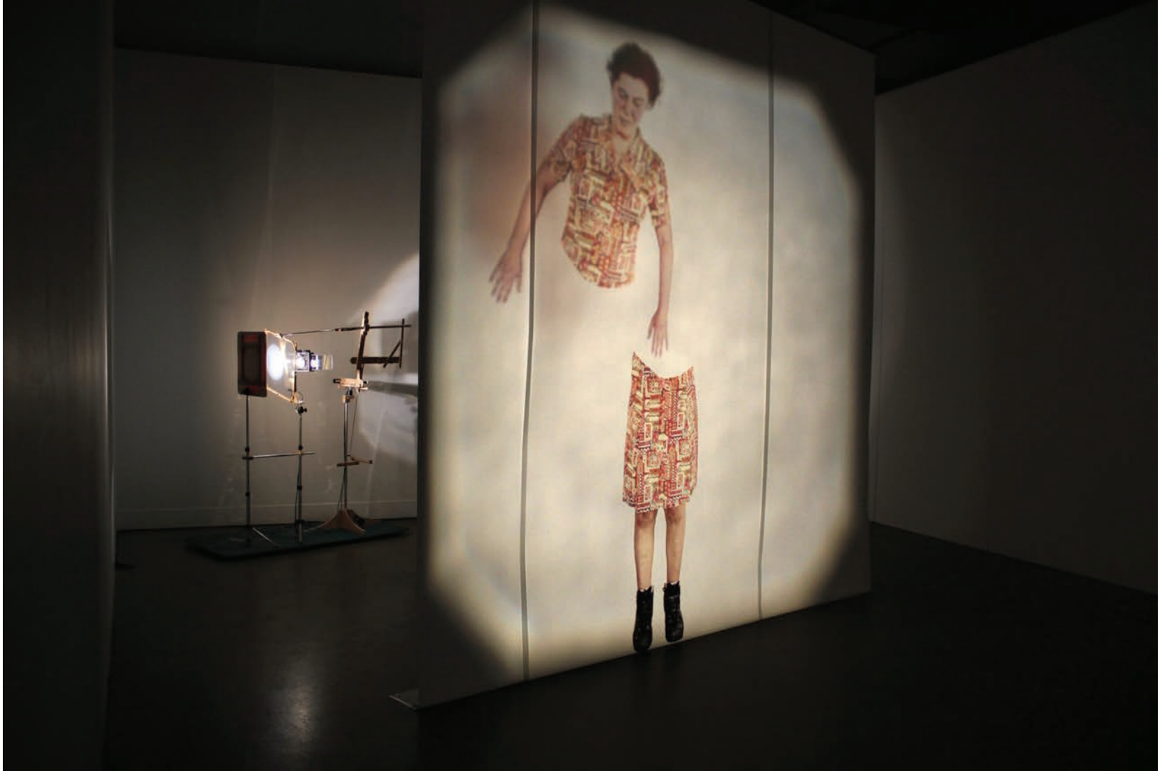
Manon Labrecque, Orbitale , 2012. Installation cinématique et sonore.

Capter le corps, son mouvement, son mécanisme, n'est pas chose simple. L'image non plus, au final, n'est pas chose simple; elle demande une panoplie bien plus apprêtée qu'on ne le supposait. Elle demande à être après bien des méandres. En plus, elle repose tout entière sur le flux lumineux et c'est celui-ci qui doit se lester d'appareils articulés et composés de miroirs dépolis, créant réflexions et réfractions. Car l'image en vient à être après être passée dans bien des sas. Ces interventions, certes, la composent. Mais le fait de voir aussi bien ces divers éléments la fragilise aussi du coup, et rend le spectateur conscient de tout ce dont elle dépend pour simplement être. Le visible est donc affaire de machines et de panoplies de vision. Il repose sur une machination dans laquelle