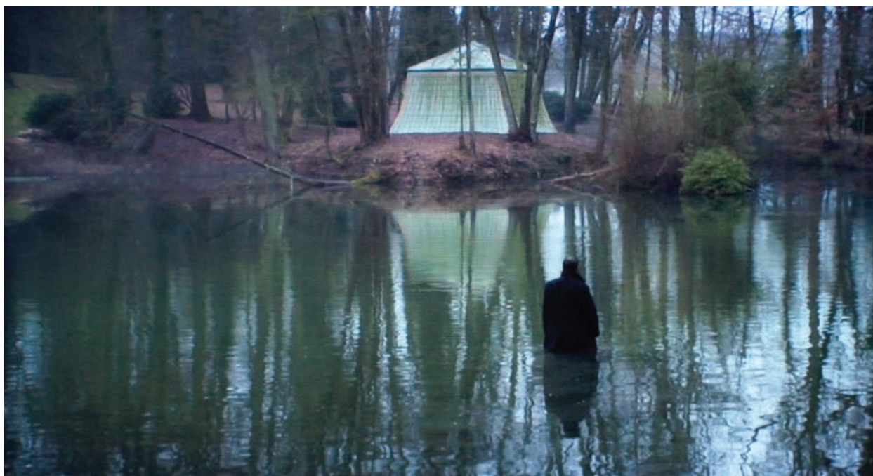
Corey McCorkle, Hermitage , 2010. Collection Frac Île-de-France.

faut-il le rappeler, fut largement redécouvert par les architectes postmodernes dans les années 80. Quant au salon, que le commissaire qualifie hâtivement de « cosy », celui-ci impose au visiteur un style bourgeois néoclassique du début 19 e , particulièrement appuyé, où toute notion de dépassement du goût ou de monstrueux devient anecdotique. Dans ce décor mouluré, le journal de l'exposition, de par son style, prend tout son sens. Distribué à l'entrée, le visiteur se plonge volontiers dans sa lecture, installé dans l'un des fauteuils qui meublent l'« Antichambre ». Il devient de la sorte et malgré lui, le figurant complaisant de cette mise en scène nostalgique. L'exposition, prisonnière du passé, enferme ainsi le visiteur dans une vision romancée et peu renouvelée du modernisme. Par delà cette tendance malheureusement bien actuelle, le projet recèle pourtant un intérêt. Celui-ci réside dans la notion d'« exposition dans l'exposition » que le commissaire évoque dans son journal. À travers ses « passages » ou ses « décrochages » scénographiques, l'exposition, au-delà du propos, révèle un genre particulier : l'exposition de fiction. L'exposition en tant que fiction dévoile alors pleinement sa propension à créer un rapport nouveau aux arts plastiques qui sont à la fois l'objet du scénario (le film de McCorkle) et son instrument puisque les œuvres sélectionnées pour l'« Antichambre » se transforment invariablement en objets de curiosité.