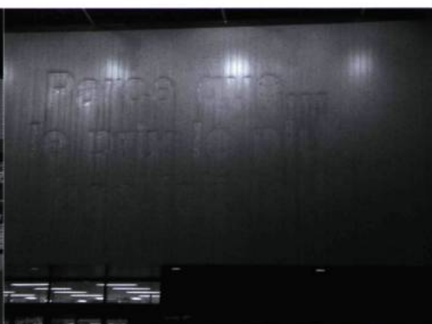
Jean-François Prost, Station Loblaws, Mur et texte effacé , 2002.

Devant l'action, je suis pris entre le désir de dénoncer, résister, confronter, et celui de cohabiter, détourner et travailler avec l'existant. Ces lieux me fascinent car tout est à réinventer, à renommer, à détourner. Malgré toutes les aberrations, les non-sens, il me paraît urgent d'observer et d'étudier les phénomènes urbains actuels : penser, observer et comprendre la nouvelle ville, son développement et son évolution particulière. Voir la périphérie autant que le centre comme zone à potentiel, tirer avantage de ces inconvénients pour élaborer des stratégies et des actions d'infiltration: travailler avec la ville telle qu'elle se développe au présent.