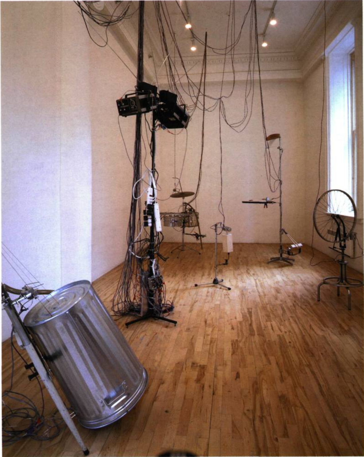
Le son iconographe , 2000. Montréal Télégraphie et Université de Sherbrooke.