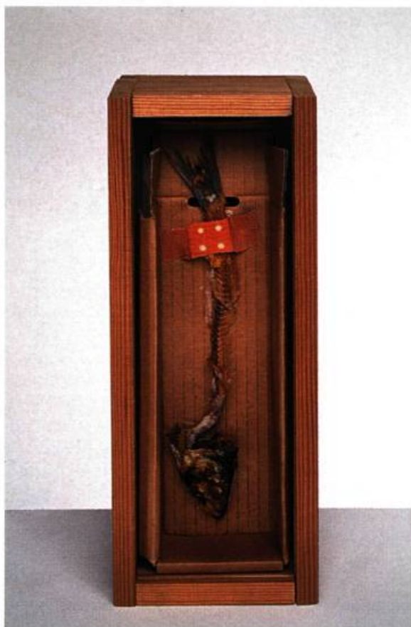
Joseph Beuys, Freitagsobjekt «gebratene Fischgrötte (Hering)» , 1970. 30, 5 x 11, 5 x 6, 5 cm. Editeur: Eat Art Galerie, Düsseldorf, 25 exp. signés, numérotés et datés + quelques uns non numérotés. (Objet du vendredi «L'arrête de poisson grillé (hareng)»).

Pour Beuys, le multiple était un Véhicule au service de ses idées, le médium de sa plastique sociale; pour l'art, il était une trouvaille, une aventure, une idéologie et une catégorie, une manière de redéfinir le statut de l'objet et du document, de leur insuffler un rôle au sein de la production artistique et enfin de se permettre de rompre avec les anciennes catégories. Car pour véritablement détruire les genres et les modèles, il peut être efficace d'en créer un qui les englobe et les rend obsolètes tout à la fois. Ce n'est