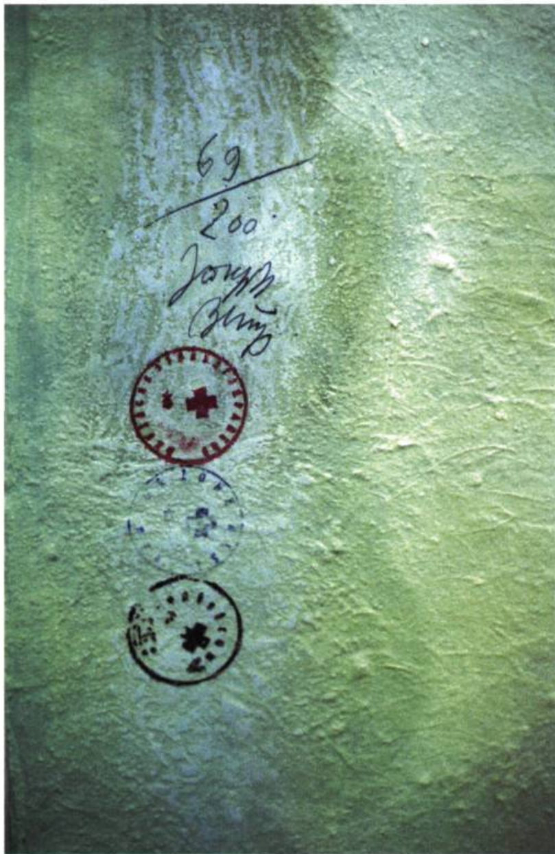
Joseph Beuys, Mit Schwefel überzogene Zinkkiste temponierte Ecke , 1970. 63, 4 x 30, 8 x 117, 3 cm. Éditeur: Klaus Stöck, Heidelberg, 200 exp. signés et numérotés. («Boîte en zinc recouverte de soufre coin tamponné», détail arrière avec signature et tampons rouge, bleu et marron)

compare avec le catalogue raisonné des multiples de Beuys, dont la dernière édition de 1992 rapporte 548 pièces. Voir à ce propos Jörg Schellmann (dir.), Joseph Beuys – Die Multiples : Werkverzeichnis des Auflagenobjekte und Druckgraphik 1965 - 1986 , München / New York, Schellmann, 1992, 7 e éd. révisée, bilingue allemand / anglais.