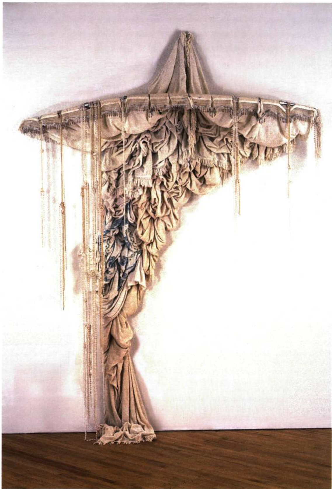
Elana Herzog, Untitled # 6 , 1997.

pièce Orb est un inextricable entremêlement de structures brodées dont sortent ou entrent trois ou quatre voies (respiration, circulation, échanges divers ?). Une quelconque sphère en orbite, partance ou arrivée ? Édifrice représente un immeuble dont le bas est en partie manquant ou masqué. On aperçoit dans la structure complexe de son architecture des coutures qui surfilent ou ont surfilé l'ensemble comme si la construction était inachevée, en voie de disparition ou d'émergence. Là, la base disparaît et s'il ne s'agit