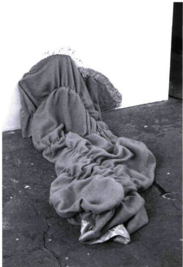
Elana Herzog, Untitled # 12 , 1996. Couverture rose en polyester, élastique, agraffes; 48 x 76 x 104 cm.

Elana Herzog & Dianna Frid, Mercer Union, Toronto. Du 18 février au 27 mars 1999