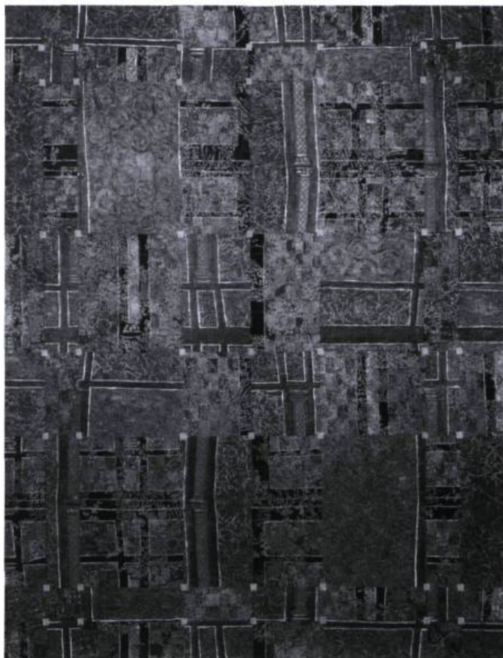
François Rouan, Peintures, dessins . Catalogue de l'exposition, juillet-septembre 1978. Marseille, Musée Cantini, 1978.

I l pourrait s'agir d'une question de temps ou bien d'histoire et surtout d'une interrogation sur la relativité telle qu'on la décrit banalement, pour la faire comprendre aux enfants : des trains ne roulant pas à la même vitesse sur des voies parallèles se dépassent dans le meilleur des cas, se croisent aussi, additionnant leurs vitesses. Les publics, les admirateurs, les spectateurs, les dégustateurs d'œuvres d'art ou bien de monuments architecturaux ne seraient-ils pas, eux aussi, dans des temps différents, dans des regards différents alors qu'ils existent dans le même espace physique ? Le voisinage quotidien d'œuvres nous transpercerait de références mémorielles, l'étonnement de la première approche nous séduirait ou nous irriterait, selon notre humeur, notre culture, nos archives.