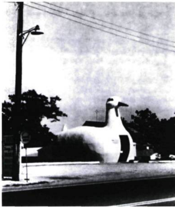
Robert Venturi, Denise Scott Brown, Steven Izenour, L'enseignement de Las Vegas ou Le symbolisme oublié de la forme architecturale . Bruxelles, Mardaga, 1978. Coll Architecture + recherches. P. 31. Photo n° 14. Le Long Island Duckling, photo reproduite de God's Own Junkyard .

présentation contemporaine de ce qu'on appelle encore œuvre d'art se montre dans l'espace éphémère de l'installation. Pensons au Bain de la rosée qui miroite (1985), Bad der verspiegelten Trautropfen , installation de Rebecca Horn au Parc Lullin à Genève, ou bien encore à la Machine paon (1982), Pfaue Maschine (Documenta 7, Kassel, 1982) 7 . « Installer » est le contraire de demeurer. Comme bien d'autres œuvres, il n'en reste que des photographies in situ (puisque le lieu, le topoi de l'installation est aussi important que l'objet de l'installation). Le fameux catalogue de Rebecca Horn, du Guggenheim Museum, est alors le témoin privilégié de cette installation. Les analogon du corps physique que l'artiste construit – pianos, ailes de papillons et d'oiseaux mus par des mécanismes acérés – se redéplient dans le catalogue. J'allais dire : il n'en reste que le catalogue « comme si » la fin de l'événement était l'avènement du catalogue et la production de la multiplication des images pouvant être conser-