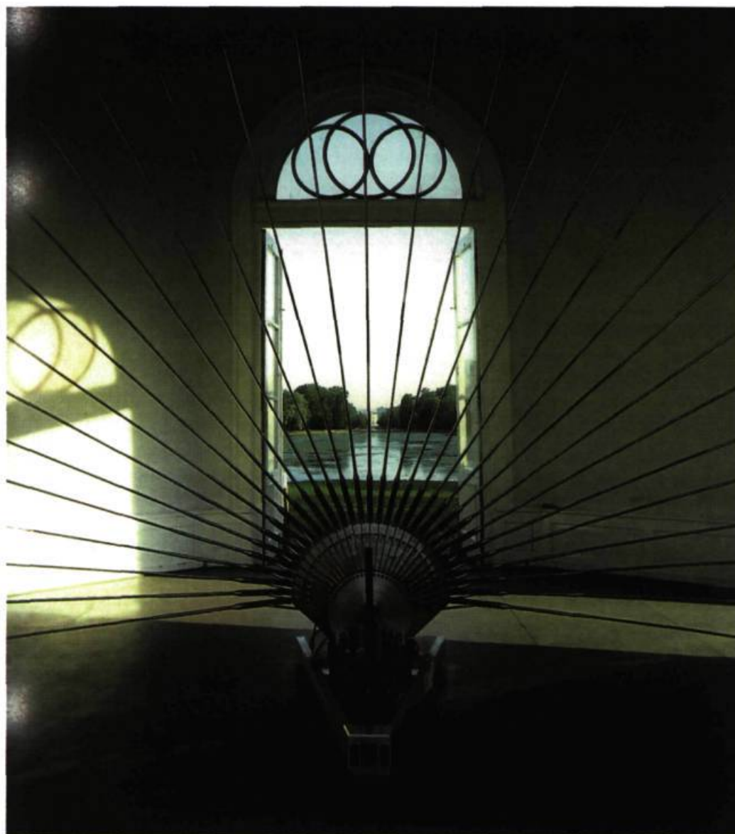
Rebecca Horn, Catalogue Musée de Grenoble, Réunion des Musées Nationaux en collaboration avec Guggenheim Museum, New York, 1995. Pflaumenmaschine (La machine-paon) , 1982. Aluminium, moteur. Documenta 7, Kassel, 1982.

symboliques et valorisées d'une époque ou d'une école, comme ce fut le cas de « Support-Surface » (circa 1968) 6 . C'est aussi le cas de François Rouan, frayant sa voie, cheminant en s'autonomisant et qui de trames en portes, d'angoisse de mort en canonisation du sexe dans les visages (ailes du nez d'un portrait de Miro des années 1920) devient un incontournable représentant de l'éclatement de l'image. Ses recompositions de paysages traditionnels de la Toscane, de l'Étrurie et du Latium tels qu'ils nous sont livrés par les peintres italiens de 1460 à 1500 en font aussi un successeur et pourtant un « avant-courrier » (comme le