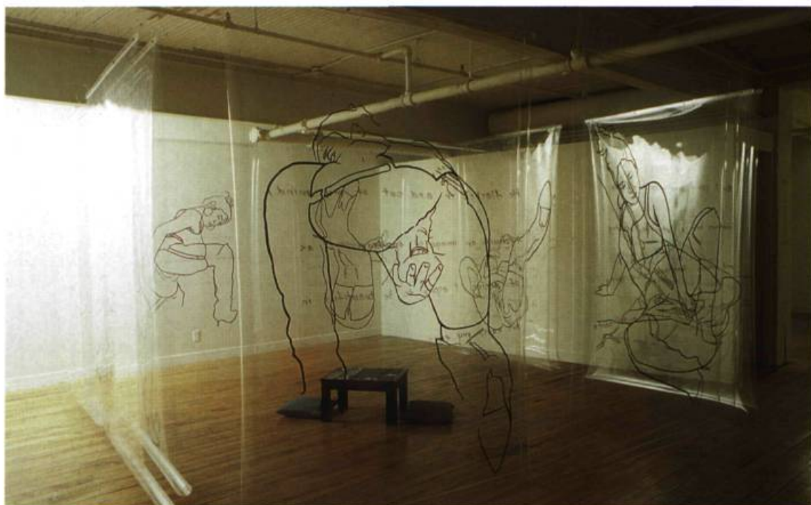
Sandra Haar, Snapshots , 1996. Dessin sur pellicule photographique transparente.

Du 5 au 27 septembre: 372, rue Sainte-Catherine Ouest, espace 522, Montréal.