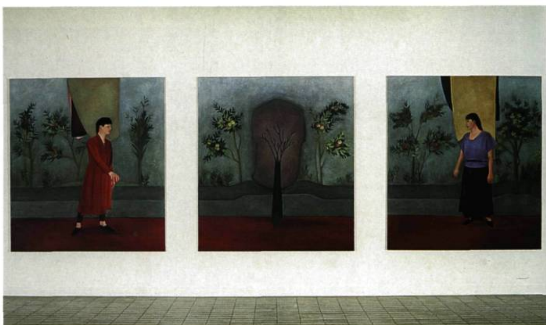
Sylvie Bouchard, Vindité , 1997. Huile sur toile; 180 x 565 cm.

Dans le cadre des activités marquants le 25 e anniversaire de La Centrale :