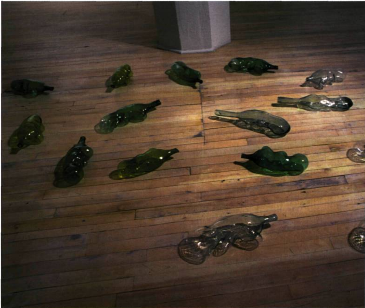
Claire Beaulieu, Immaculée conception , 1997. Objets de verre.

Claire Beaulieu, La mariée , Occurrence, Montréal. Du 17 janvier au 15 février 1998