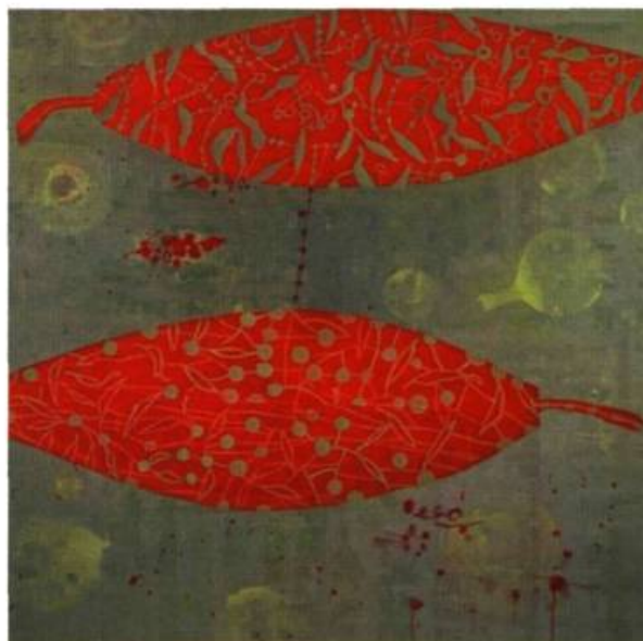
Claire Beaulieu, La mariée , 1997. Acrylique sur toile; 124 x 124 cm.

d'ailleurs ce qui se passe avec les deux séries de toiles exposées. La première, composée de quatre tableaux de 4' par 4', crée un espace optique débordant du cadre et rejoignant le visiteur. Ce type d'espace est le résultat d'un subtil jeu sur la transparence des couleurs. Avec une grande finesse, Beaulieu superpose des couches de couleurs pas-