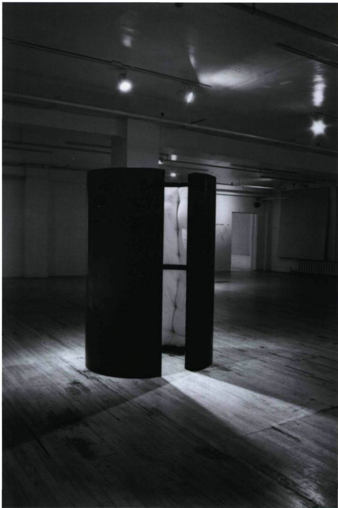
Josée Dubeau, La camisole de force , 1996. Métal et futons; 182,8 x 122 cm.