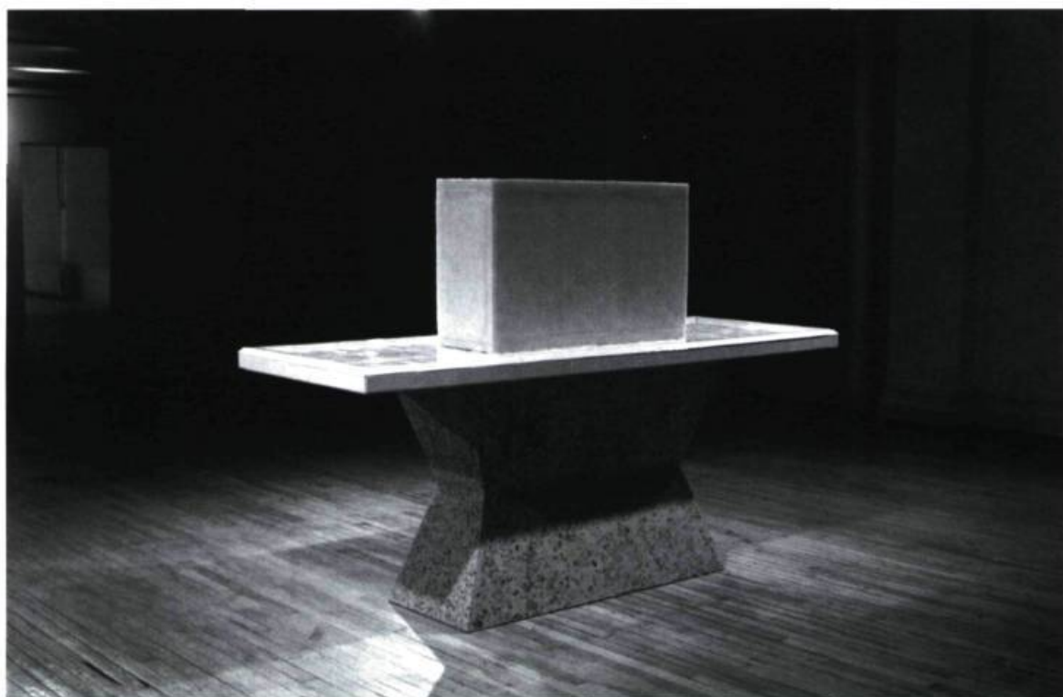
Josée Dubeau, L'autopsie , 1996. Céramique, pierres, mastic à carrosserie, cire; 165 x 200, 6 cm.

base est fabriquée en terrazo, supporte une table en carreaux de céramique blanche ayant un caractère obsessionnel vis-à-vis la mort mais de surcroît, cette table supporte elle-même un bloc de cire qui possède toujours une vie mystérieuse associant la matière à l'esprit. La cire vit dans l'appropriation du travail de l'abeille par l'homme. En fait, Josée Dubeau ne réduit pas l'être à son expérience biologique mais elle le fait vivre par la pensée.