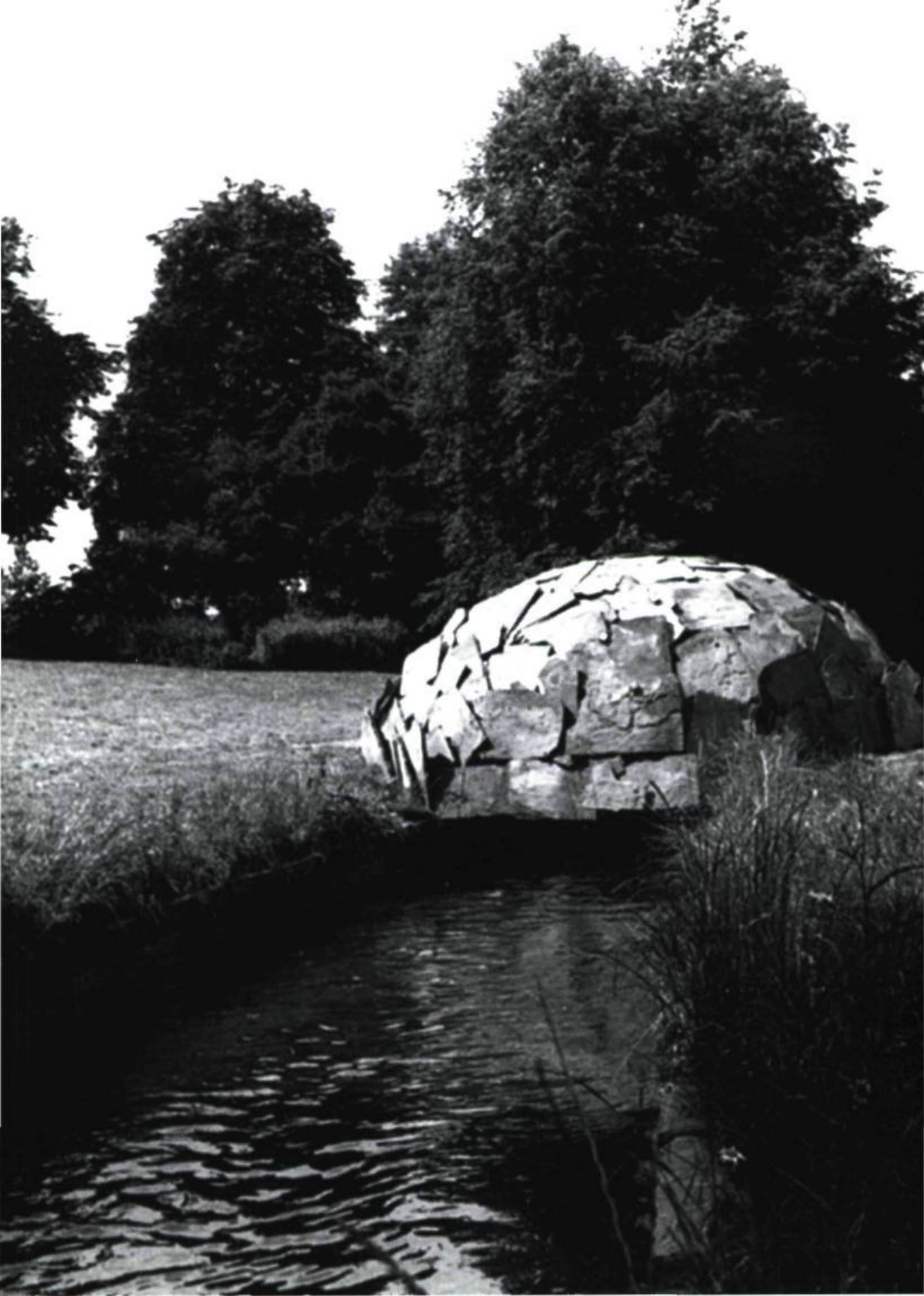
Mario Merz, Igloo de pierre , 1982. Structure hémisphérique en métal et en pierre.