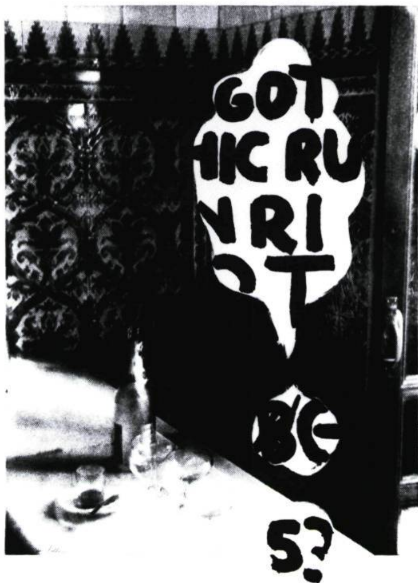
Julian Schnabel, Gothic Run Riot , 1990. Photolithographie, bois gravé, eau-forte, sérigraphie; 161 x 145 cm. Éditeur : Pace Prints, New York.

Turrel, mais aussi chez les artistes canadiens et québécois.