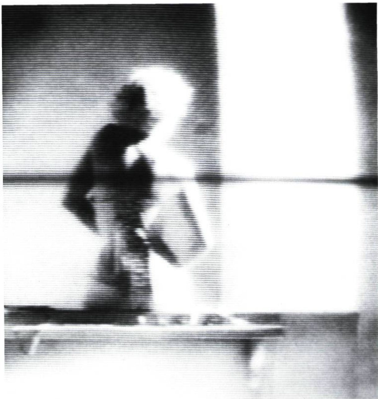
Madonna, Vogue , vidéo-clip.

que la chronophotographie dissèque, découpe, fait éclater les choses en les ralentissant... le cinéma ne durera pas ». C'est à relier à la manière scientifique que l'on avait de voir le monde : comme en médecine, il s'agissait d'analyser le corps lorsqu'il était mort, il fallait arrêter la vie, arrêter le mouvement. Il y a donc une voie théorique par découpage