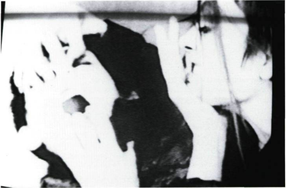
Les Rita Mitsouko, Y'A D'LA HAINE, 1993. Vidéo-clip.

notre faim et en même temps nous satisfait sur le plan psychophysiologique. C'est semblable à la décharge d'images du fonctionnement schizophrène qui par nature ne refoule rien, ce qui est une extrême excitation du désir.