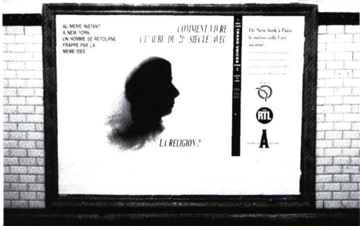
Jochen Gerz, Comment vivre . Affiche métro. (Paris, New York). 120 x 150 cm.

vent devant le texte moderne ( illisible ), le film ou tableau d'avant-garde : s'ennuyer veut dire qu'on ne peut pas produire de texte, le jouer, le défaire, le faire partir . 2 La vulgarisation, restriction appauvrissante, immobilise les facultés intellectuelles et perceptives par son niveau primaire de participation. Sous une fausse représentation, certains intervenants du monde de l'art vous diront qu'il faut bien expliquer les œuvres au public, mais ce qu'ils omettent ce sont les impératifs d'entrées et de rentabilité tout en livrant une sorte de digest , de résumé de l'œuvre. La propagande des œuvres compréhensibles par tous n'a pour but que de légitimer certaines institutions, publications et notabilités, en tout genre, autre qu'artistique. Les panégyristes qui vantent la culture à base de vulgarisation (culture pure, noble, universelle) ne sont que des machines à niveler et entretiennent une confusion culturelle. Les obligations et les règles de l'universalisable développent une désaffectation du savoir et une désaffectation du voir.