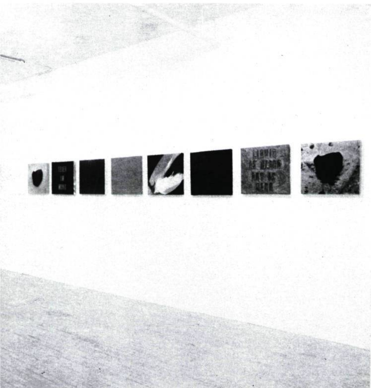
Brigitte Rodecki, Cadavre exquis (vue partielle) , 1993. Techniques mixtes et photographie sur toile.

l'œuvre, isolé, renvoyant alors aux trous noirs dans l'espace. Ces tableaux sont disposés très près les uns des autres, cette grande linéarité de la vue d'ensemble crée une coupure formant virtuellement une ligne d'horizon. Cette division des murs de la salle d'exposition en double espace instaure aussi une rime formelle avec l'horizontal des écritures. Ainsi l'évocation paysagée de l'œuvre est aussi inscrite dans la disposition étendue et linéaire des tableaux la