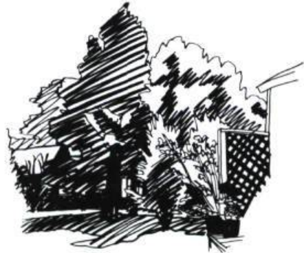
Tom Wesselmann, Jeannie's Backyard, East Hampton (noir) , 1990. Coupée au lazer, acier