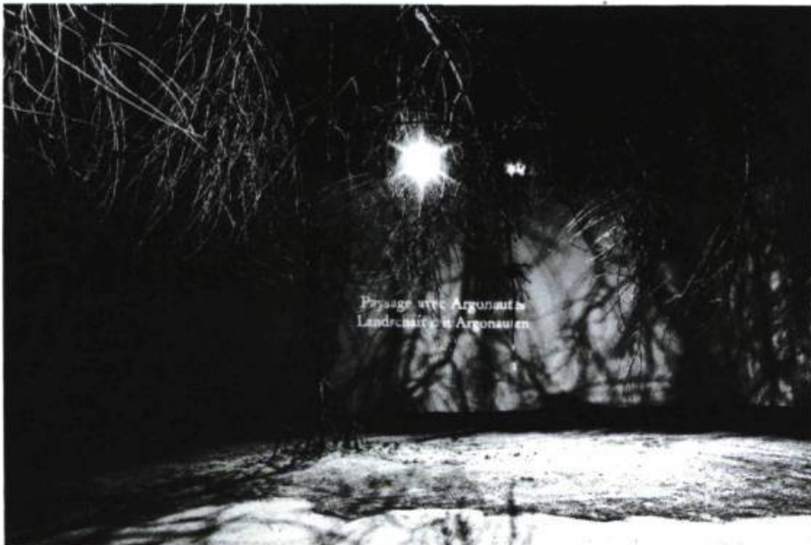
Paysage avec Argonautes Landscape with Argonauts

la même fin de saison à Montréal à l'occasion du Festival des Amériques : on vient d'en donner une présentation nocturne au Monument national, pour les congressistes de l'Ordre international des architectes, le 30 mai dernier, puis une autre, au festival de Chicago, la semaine suivante. Pas un traître mot n'est prononcé durant ce spectacle. Le personnage central est une... pierre. Pierre encombrante des jardins, pierre utile des moutures, pierre symbolique des décès : on nous joue, sans paroles, l'histoire de notre géographie et de la géographie de notre histoire. Les enfants d'Italie, du Québec puis des États-Unis ont tout ce qu'il faut pour comprendre ce qui se passe dans ce castelet renversé (on ne voit que le bas, la terre, les jambes). La gestuelle de ce théâtre du silence n'était pas celle du mime, augmentée, symbolique, mais bien celle du théâtre, d'un théâtre presque réaliste.