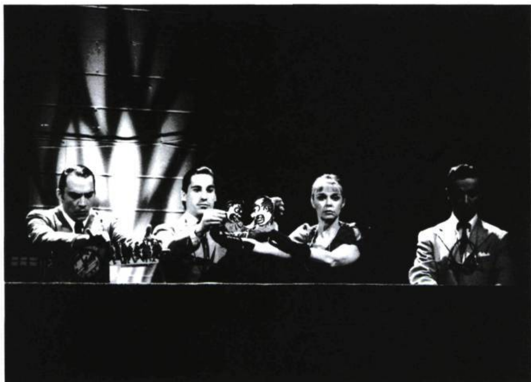
Les Enfants terribles, M. X. solitaire

façon beaucoup plus proche des jeux interdits qu'on connaît, grâce à la mise en scène de Martin Faucher et au décor de Danièle Lévesque. Le concept scénique des deux pièces est pourtant le même, sauf que, de la première à la deuxième œuvre, les murs se sont redressés et surchargés (le mur du fond est fait d'aquariums), que les autos miniatures sont devenues des Buick réelles et neuves et que l'adolescence des personnages qui nous sont familiers en semble d'autant plus montée en graine. Décor superbe, cependant, et le public l'applaudit au lever du rideau.