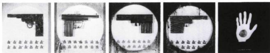
Jean-Pierre Gilbert, Les Révolutions , 1989. Techniques mixtes; 14 x 70 po.

me de répliquabilité parfaite. Par conséquent, les artistes de KOMPAKT prouvaient non seulement que le multiple n'entraîne pas d'emblée une perte d'unicité ou d'originalité — ce que les portraits sériels de Warhol ont déjà magistralement démontré —, mais que le principe de répétition et de réplique régit et ordonne presque invariablement la naissance de chaque œuvre en atelier. C'est à partir du déjà fait que l'inédit s'élabore; du tableau d'hier naît celui qui est en chantier. N'est-ce pas en effet par la reprise incessante et presque pénélopienne des mêmes gestes, des mêmes matériaux et des mêmes problématiques que l'artiste, peintre ou sculpteur, découvre de nouvelles avenues pour mettre en forme la suite de ses œuvres? C'est donc aussi de différence que l'exposition Séries KOMPAKT traitait. Différences au sein d'un ensemble d'œuvres d'un même artiste et diversité des pratiques artistiques réunies durant un court moment dans un espace partagé.