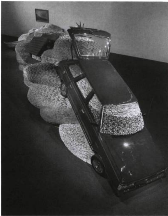
David Mach, The Art that Came Apart . Détail.

instaurée par Duchamp avec son célèbre urinoir exposé en 1917 à la Société des artistes indépendants, à Paris.