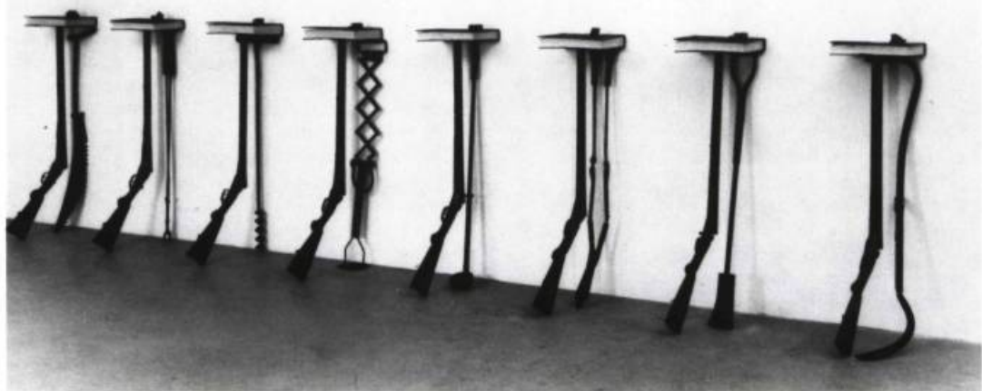
Michel Goulet, Proximités , 1988. Acier et objets divers; 203 x 153 x 450 cm.

A u mois dernier, la galerie Christiane Chassey présentait le travail récent de Michel Goulet. Exposées à titre de prémisses à la Biennale de Venise, les œuvres de l'artiste ont encore une fois suscité beaucoup d'enthousiasme du côté de la critique.