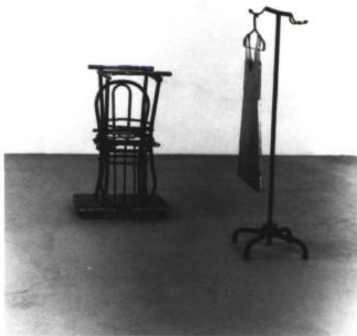
Michel Goulet, Les rapprochements inattendus , 1988. Cuivre, tôle galvanisée et objets divers.

Autre fait à signaler : l'aspect baroque de la ligne donné par la répétition de certains motifs. Même si les compositions de Michel Goulet semblent toujours respecter un ordre quelconque, il reste que divers assemblages (le lit dans Proximités , les chaises dans Stories et Les rapprochements inattendus ) occasionnent pour l'œil beaucoup de mouvement qui structure l'espace-temps. Par ailleurs, l'intensité que cela favorise au niveau des liens entre les objets (ou matériaux) fait en sorte qu'on arrive difficilement à fixer son attention sur un point bien précis. C'est là tout l'intérêt d'un travail comme celui-ci : créer, indépendamment du lieu, des «ensembles» qui en génèrent d'autres; qu'ils soient de l'ordre de la pratique ou du théorique. Peu importe; pourvu qu'ils puissent à leur tour faire profiter l'imaginaire des situations où la mémoire des choses perçues pose des questions et s'interroge sur ce qui les a motivées. Ainsi la mobilité du motif réfère donc à un spectateur qui se déplace là où