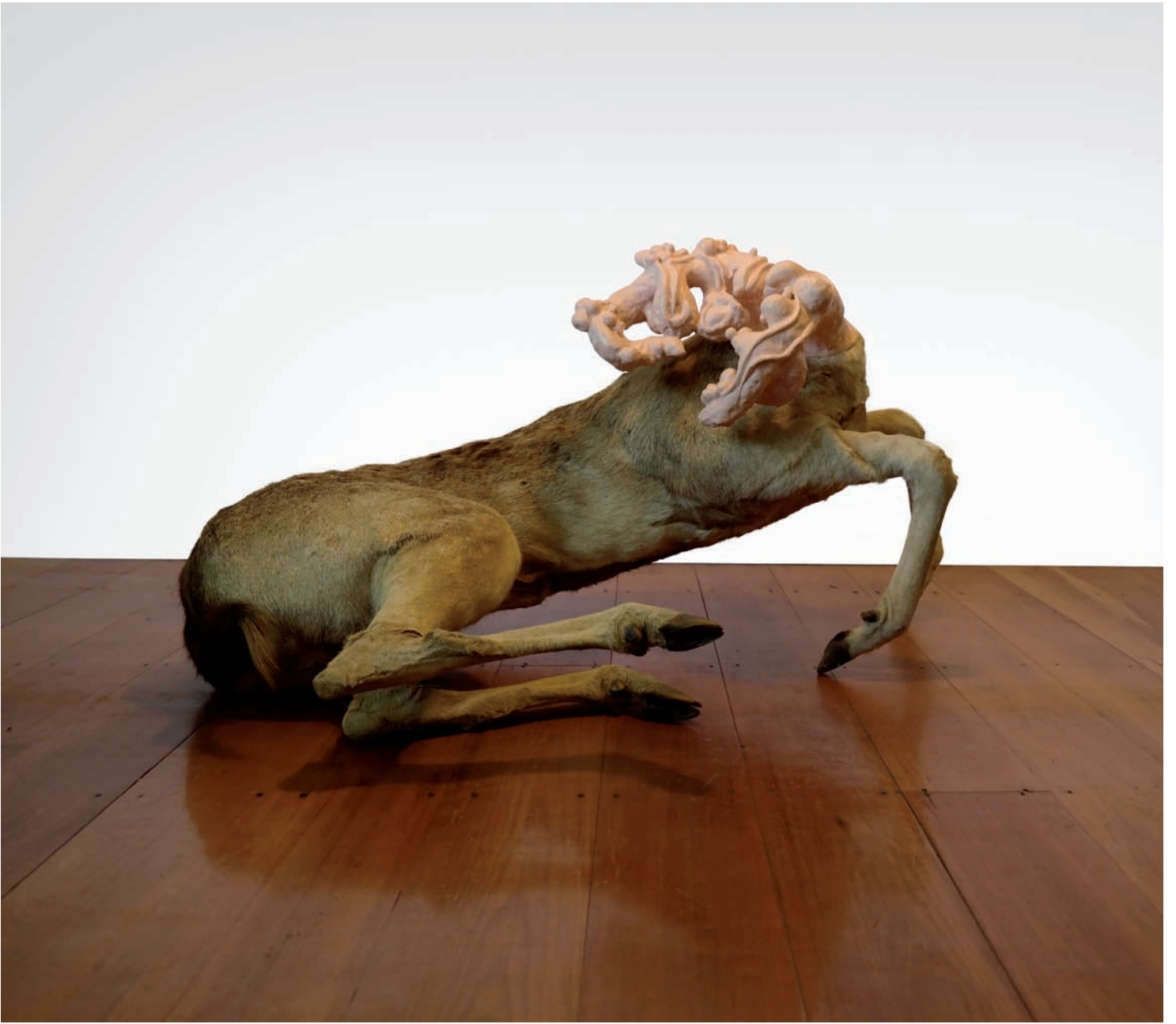
Angela Singer Spurts series , 2015.