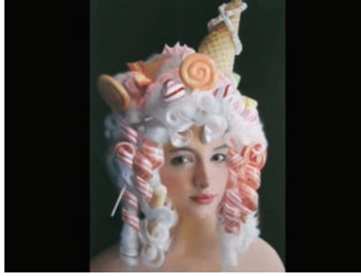
HENNESSY YOUNGMAN, ART THOUGHTZ: ON BEAUTY, CAPTURE VIDÉO | VIDEO STILL, 2011.

probablement là que réside une bonne partie des problèmes méthodologiques que présente l'analyse de cette situation.