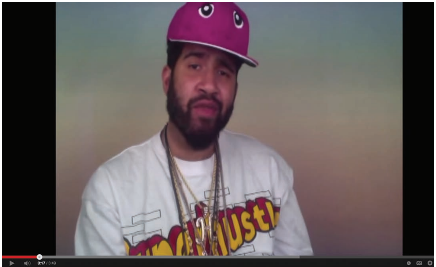
HENNESSY YOUNGMAN, ART THOUGHTZ: THE STUDIO VISIT & ART THOUGHTZ: GRAD SCHOOL , CAPTURES VIDÉOS | VIDEO STILLS, 2012. PHOTOS : PERMISSION DE L'ARTISTE | COURTESY OF THE ARTIST