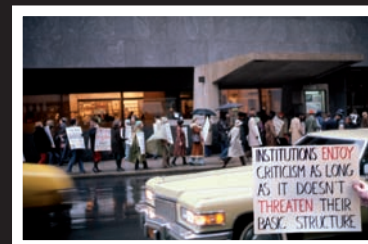
Carole Condé et Karl Beveridge, Cultural Signs: Protest of Bi-centennial Exhibition (Rockefeller Collection) at Whitney Museum, New York , 1975.