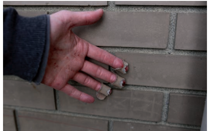
STEPHEN MUELLER, PERFORMANCE, EVENEMENT PHANTOM WING EVENT, 2013.