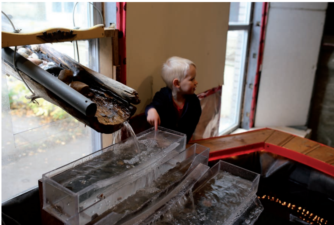
LANE SHORDEE, WATERWAYS, DETAIL | DETAIL, EN COLLABORATION AVEC I IN COLLABORATION WITH ANTYX, IVAN OSTAPENKO & ALIA SHAHAB, 2013.

ce pouvoir et proposer des liens avec l'insaisissable, c'est-à-dire ce qui ne peut-être défini ou transmis en tant que pouvoir.