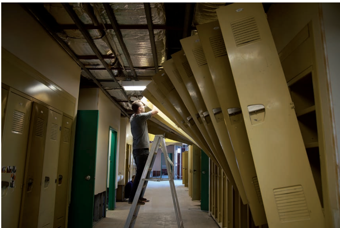
PREPARATION DE L'EVENEMENT | PREPARATION OF THE EVENT PHANTOM WING, 2013.