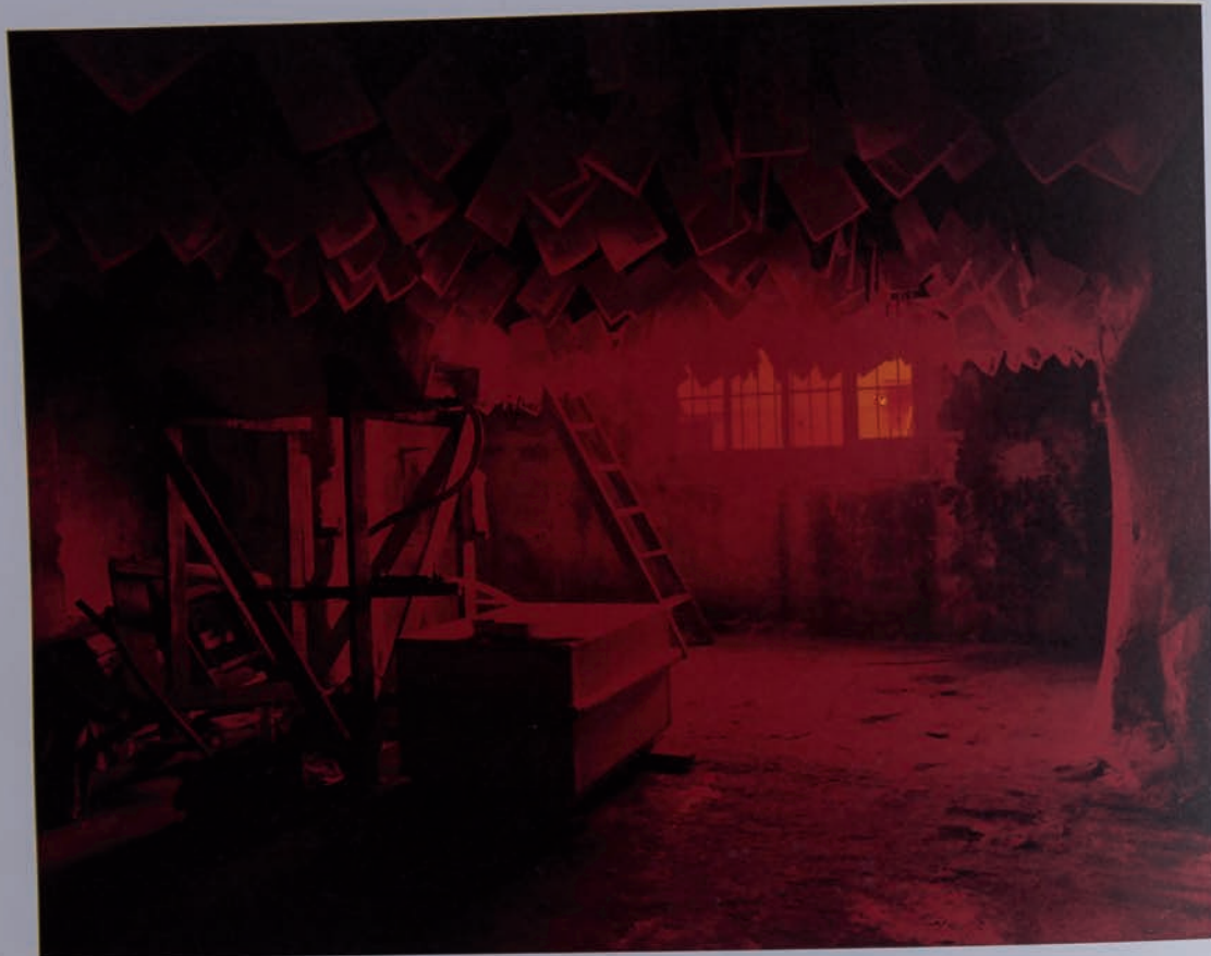
12 Magazin: Büyük Valide Han