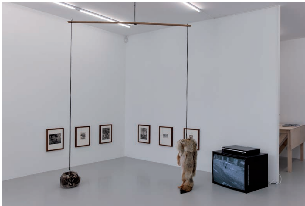
ENACTING POPULISM IN ITS MEDIASCAPE, VUE D'EXPOSITION, KADIST ART FOUNDATION, PARIS, 2012.

[Translated from the French by Peter Dubé]