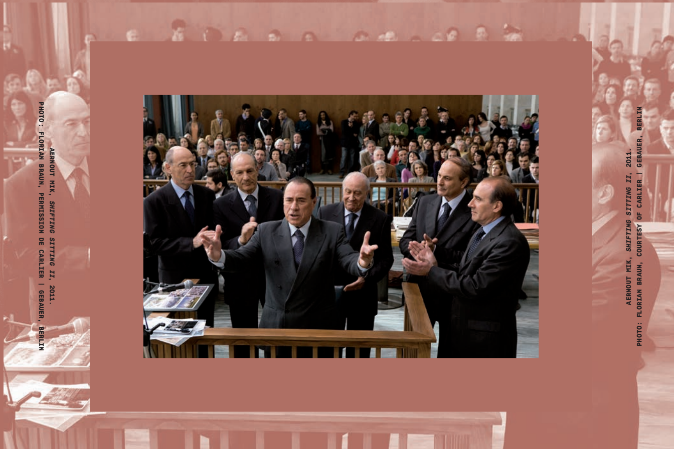
AERNOUT MIK, SHIFTING SITTING II, 2011.