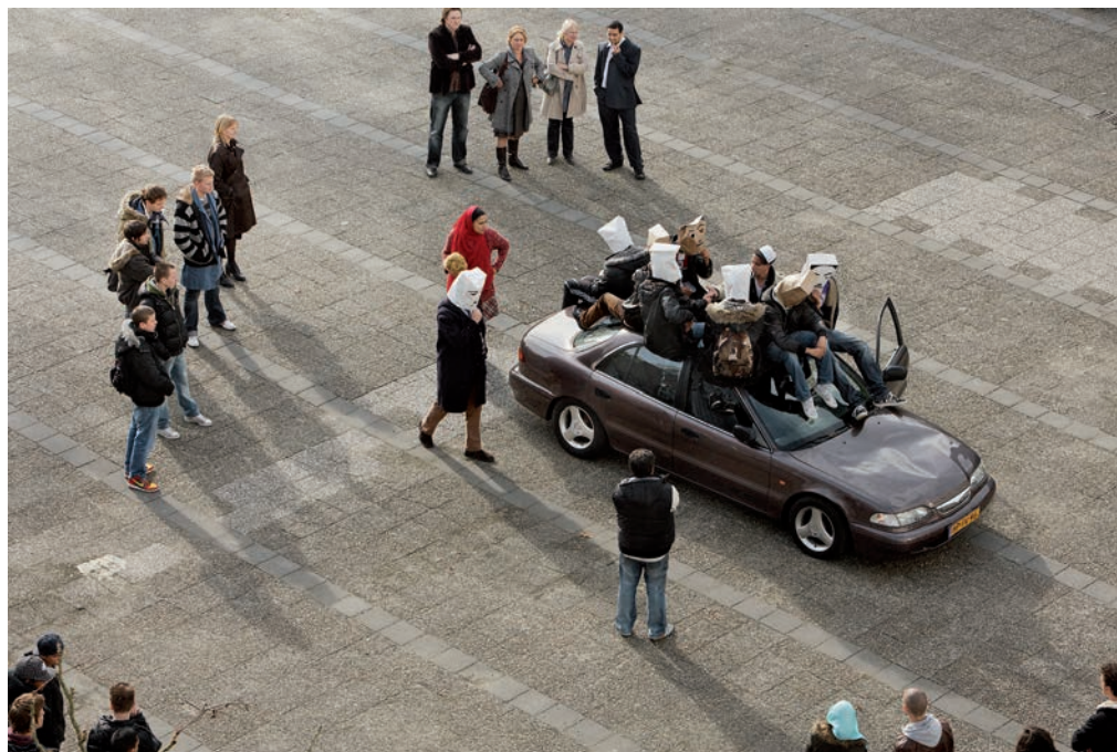
PHOTO: FLORIAN BRAUN, COURTESY OF CARLIER | GEBAUER, BERLIN AERNOUT MIK, SCHOOLYARD, 2009

PHOTO: FLORIAN BRAUN, PERMISSION DE CARLIER | GEBAUER, BERLIN AERNOUT MIK, SCHOOLYARD, 2009