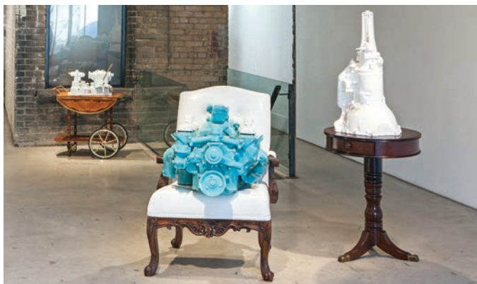
Clint Neufeld, installation view, 2013