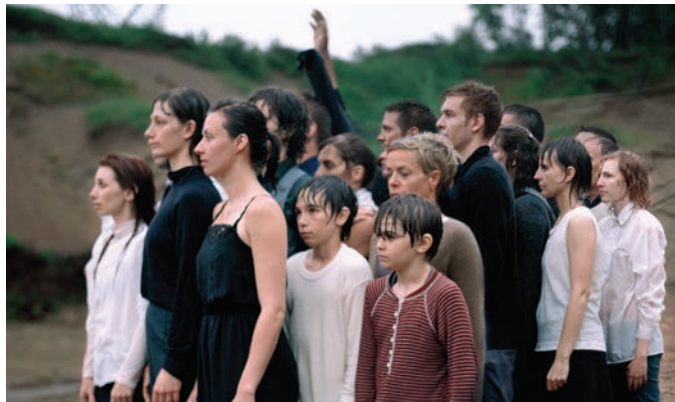
Jacynthe Carrier, Parcours , 2012. photo : © Jacynthe Carrier