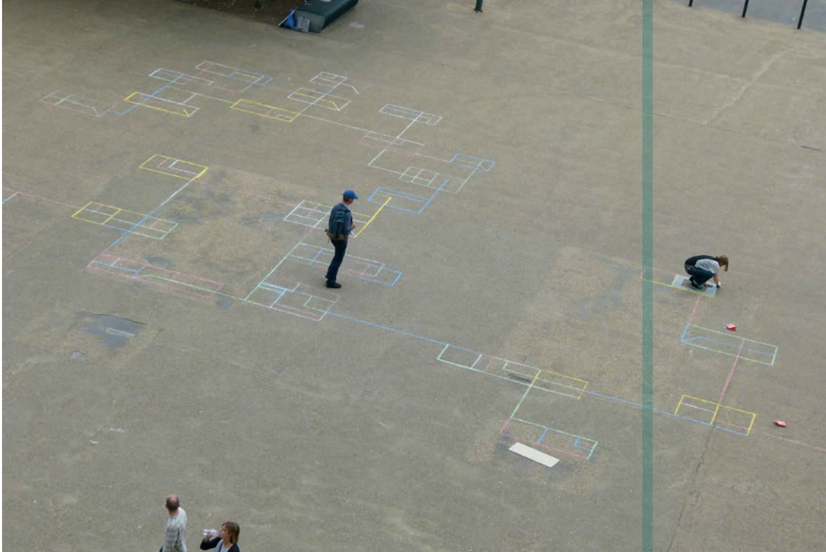
Josée Dubeau, Calendrier , intervention à grande échelle | large scale intervention, Tate Modern, Londres, 2011. © Josée Dubeau / SODRAC (2012) | photos : Grégoire Eberley