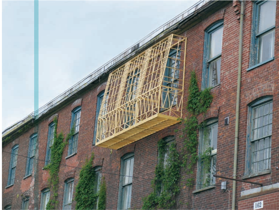
Josée Dubeau, Pavillon , Le 3 ème Impérial, Granby, 2008. © Josée Dubeau / SODRAC (2012)

le temps 3 ». Délimitant avec précision, dans son atelier, des espaces où se déployaient divers types d'actions, de performances ou de modèles, Nauman exploitait le corps et des éléments de base (comme la ligne, le rythme, la durée et la répétition) pour décloisonner les notions et les propriétés du temps et de l'espace. Par exemple, dans Dance or Exercise on the Perimeter of a Square (Square Dance) (1967-1968), l'artiste se déplace méthodiquement autour du périmètre d'un carré tracé sur le plancher de son atelier, chaque pas faisant la moitié de la longueur d'un côté, sur le rythme d'un métronome à peine audible en arrière-plan. À mesure que Nauman trace l'espace physique de son atelier, il se trouve par le fait même à élargir l'espace notionnel du processus créatif : le temps et le mouvement, la durée et la résistance se manifestent, bien vivants à l'intérieur même de leurs représentations visuelles. Dans ses œuvres ultérieures, comme Stamping in the Studio (1968) et Wall-Floor Positions (1968) – transpositions littérales et élargies de leur titre –, Nauman repousse encore les limites du rapport au temps et au processus créatif, puisque chaque vidéo dure plus d'une heure.