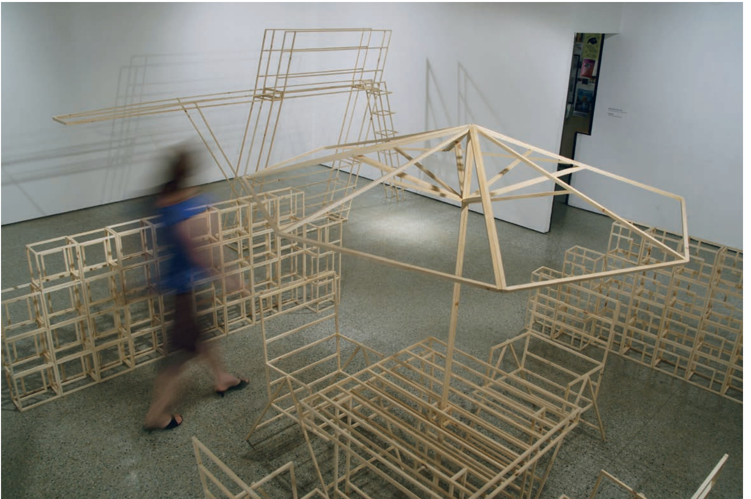
Josée Dubeau, Suburbia , Saw Gallery, Ottawa, 2007. © Josée Dubeau / SODRAC (2012) photo : permission de l'artiste | courtesy of the artist