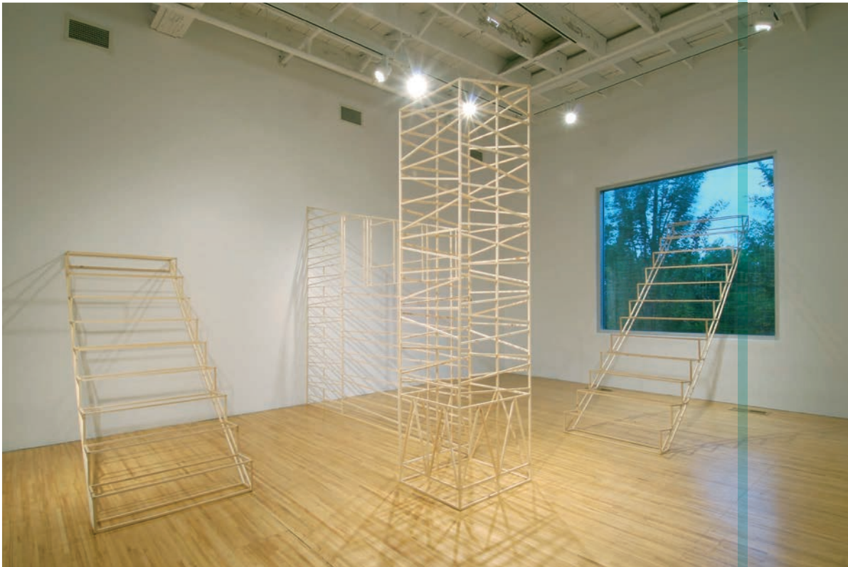
Josée Dubeau, Dédoublement , Axénéo 7 art contemporain, Gatineau, 2008. © Josée Dubeau / SODRAC (2012) | photos : David Barbour