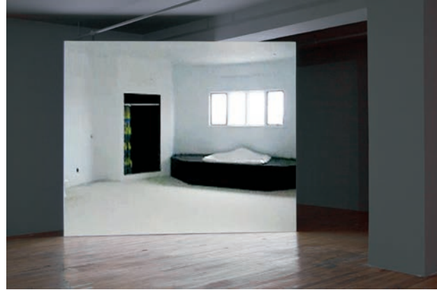
Patrick Ward, Monologue , 2009.

C'est aussi ce que l'on peut observer dans les banlieues américaines : une sensation d'absence (de sujets) produite par la mise en valeur de la présence des choses. Ces lieux ont quelque chose de la ruine, cette fois sans abandon ni déréliction, sans aucune temporalité, non d'une manière métaphysique, mais plutôt comme des objets virtuels informatiques : par la vertu d'un nombre qui assure la répétitivité sans différence, la sécurité et le contrôle par l'élimination du hasard. L'objet est animé au prix de la singularité, et il triomphe idéalement de la corruptibilité. C'est ce que nous lisons dans une étude de la banlieue contemporaine menée par Jason Griffiths : « La représentation courante du vide suggère une absence ou un délabrement physique ; dans les banlieues, c'est le contraire qu'on a observé. Le vide profond des banlieues [est] étrangement mis en valeur par leur opulence même [...] Il est habité par la présence morose d'objets qui semblent rarement utilisés, mais régulièrement entretenus 8 . » Et l'on pourrait en dire autant des corps chez Beecroft.