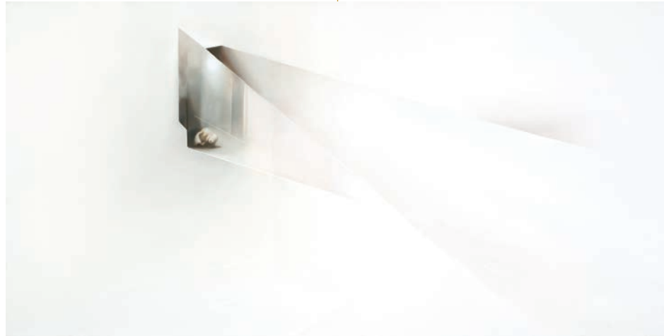
Magalie Comeau, Suspension habitable , 2012. photo : Richard-Max Tremblay, permission de l'artiste courtesy of the artist & Art Mûr, Montréal

On trouve dans la pensée occidentale un partage épistémologique, politique et phénoménologique entre sujet et objet. L'arrivée de l'informatique a bouleversé ce clivage au sein des pratiques artistiques de sorte que le sujet et l' objet , sans cesser d'être des notions clés, ont changé radicalement de sens. D'un paradigme métaphysique et signifiant qui déterminait le couple sujet-objet, nous sommes passés à un paradigme algorithmique, lequel met en jeu une logique numérique et économique. Penser l'objet animé en art implique donc, aujourd'hui, de considérer la désactivation du couple sujet-objet par l'informatique, tant dans un déplacement de la subjectivité que dans un nouvel investissement de l'objet en tant qu'objet. Les modalités qui témoignent de ces changements sont nombreuses : la subordination de l'analogique au numérique ; l'animisme et la sérialisation, dans un effacement de la singularité ; l'absence morbide du sujet dans une mise en scène de l'objet solitaire et ruiné.