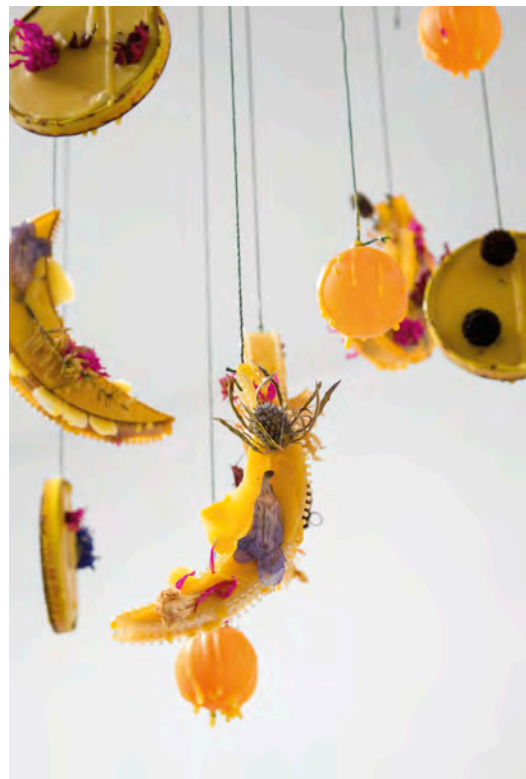
Lucien Durey. Stardust , 2020. Dish rack, bumples, jar lids, ping pong balls, flowers, beeswax, hammock string, 61 x 38 x 33 cm.

Crocodiles weep when devouring their prey—not with emotion, but of physiological necessity. The aphorism “crocodile tears”—tinged with Christian repentance—emerges in Western literature in parallel with colonialism: perhaps also a subconscious self-portrait of its deceitful sociopathy. This “counterfeit humility,” the theme of Unit 17's three-part exhibition, is uncomfortably fitting for our times: general mistrust of humanity in an era of political and public insincerity—and as our COVID-19 pandemic has exposed, the exacerbation of inequalities amidst the injustices of neoliberal white supremacy and the performance