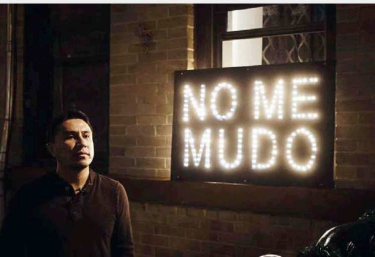
Mi Casa No Es Su Casa : Illumination Against Gentrification, 2015. Une des enseignes lumineuses disséminées dans Bushwick, New York.

que tous les occupants des locaux situés du côté ouest du boulevard Saint-Laurent, entre le Monument-National et la rue Sainte-Catherine, soient délogés. Le Cabaret Cléopâtre a gagné sa bataille devant les tribunaux et sa bâtisse sera finalement encastrée dans le nouveau complexe, mais ses voisins ont tous plié bagage. Lors des consultations publiques portant sur la réalisation du Quadrilatère St-Laurent, des participant.e.s ont indiqué que le cadre bâti de cette portion de la Main était très dégradé, ce qui justifiait, à leurs yeux, la rénovation urbaine annoncée. Le mémoire de la table de concertation Habiter Ville-Marie mentionnait toutefois qu'elle entraînait la disparition d'une grande maison de chambres, ce qui contribuait à la précarisation de plusieurs personnes à risque d'itinérance 7 .