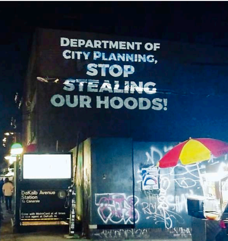
Mi Casa No Es Su Casa : Illumination Against Gentrification, The Illuminators et G-Rebels, #NoRezoningBushwick, 2018. Projection temporaire contestant un projet de modification de zonage qui permettra la construction de luxueux immeubles résidentiels dans un secteur de Bushwick, New York.