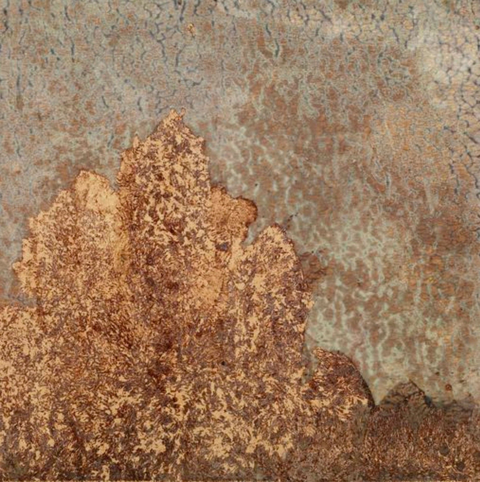
Michel Blazy , Paysage : Montage , 2008. Crème dessert au chocolat et à la vanille et œufs sur bois grignoté par des souris, 60 x 80 cm. Avec l'aimable permission de l'artiste et de Art : Concept, Paris. Photo : © Fabrice Gousset.

à la galerie Art:Concept, intitulée Comment faire avec les crabes, les coléoptères, les fourmis, les lézards, les oiseaux et les fourmis? , mettait déjà en doute ces certitudes en soulignant la possibilité d'une création interspèces. Conjuguant des espèces que notre société qualifie de « sauvages » ou de « nuisibles » – ces dernières sont généralement de petite taille, et il est plutôt d'usage de les exterminer que de les valoriser ou de les préserver –, Michel Blazy a mis en place des dispositifs offrant une place importante à l'indéterminé et au vivant. L'animal y apparaît tant dans le processus de création que dans les expositions. Ainsi, ce sont autant de souris, drosophiles, fourmis, moustiques, araignées, etc., qui ont pris part in vivo à ses expositions et à l'élaboration de ses œuvres.