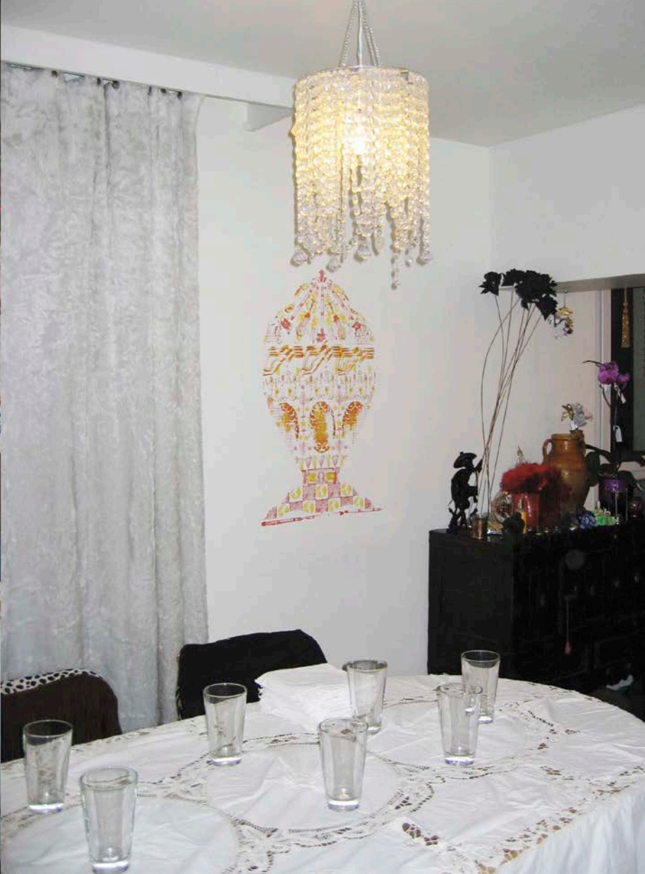
François Morelli, Home Wall Drawing, 2004. Dessin mural au tampon encreur en échange d'un repas, France/Inking pad wall drawing in exchange of a meal, France.

Entre la porosité des corps et la fluctuation des rencontres, il est important de noter que la première marche inscrit la frontière au centre des préoccupations de l'artiste 3 . En effet, à la fondation de ce cycle de marches, n'est-il pas significatif que l'artiste quitte Manhattan depuis l'édifice des Nations Unies à New York ? Le géographe Henri Dorion a clairement signalé que le siège des Nations Unies accueille « les grands de ce monde » qui « tentent, par conviction ou par intérêt, de sortir les frontières des ornières où la géopolitique internationale les a enfoncées 4 . » Soumettant à l'attention du public un doute quant à l'atteinte de cet objectif, Dorion rappelle tout de même que le but ultime des joutes oratoires de cette noble enceinte est de redonner aux frontières la fonction qui devrait être la leur, à savoir le rapprochement entre les communautés et les nations 5 . Avec ceci en tête, il devient clair que les performances de Morelli souscrivent non seulement à une logique déambulatoire et identitaire, mais qu'elles tiennent aussi du phénomène migratoire.