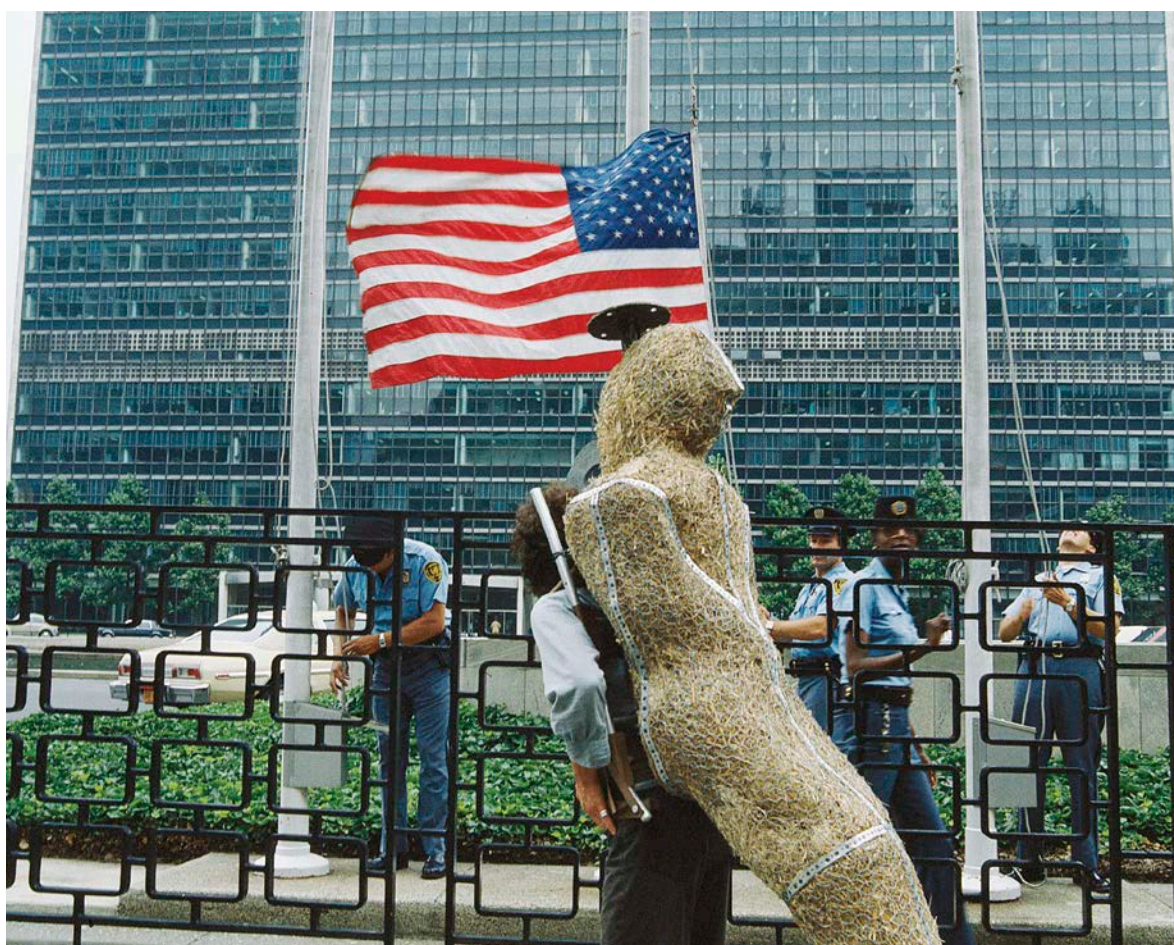
François Morelli, Migration , 1984. P. 44 : Performance, New Jersey. P. 45 : Performance, Nations Unies, New York.

L'analyse de la fortune critique de Morelli montre que, dans le passé, ces performances, pour l'essentiel, ont été rattachées à la question de la marche dans l'art contemporain, un sujet passablement documenté, ce dont témoigne, entre autres, la présence de Morelli dans l'exposition itinérante Walk Ways en 2002 1 . Or, le présent dossier motive à y trouver de nouvelles manières d'aborder cette dimension et, pour filer une métaphore attendue, d'autres raccourcis qui sont ceux que Morelli emprunte continûment dans sa pratique. Alors que le projet de l'artiste visait les notions de seuil et d'espace liminal, il suffit de rapporter ces pérégrinations sous l'angle de l'étendue géographique pour se rendre compte que les problématiques soulevées par ces déambulations au grand cours débordent largement de strictes considérations sur la mise en contact d'espaces privés et publics, les rencontres inusitées, la dérive ou l'errance. Car à l'échelle où se produisent les marches de Morelli, ses déplacements appartiennent à des enjeux pour lesquels les frontières sont essentielles et leurs traversées, cruciales.