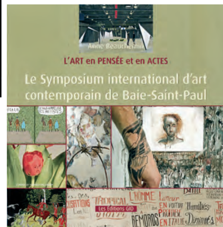
Anne BEAUCHEMIN, L'art en PENSÉES et en ACTES. Le Symposium international d'art contemporain de Baie-Saint-Paul . Les Éditions GID, Québec 2013, 139 p. Leseditionsgid.com

tions du groupe et d'une biobibliographie, ce livre, également illustré de photographies, de document d'archives, de pictogrammes, de facsimilés de toutes sortes, s'avère un précieux ouvrage afin de conserver la mémoire d'un mouvement qui a agi de façon novatrice au sein du milieu de l'art des années 1980 et 1990.