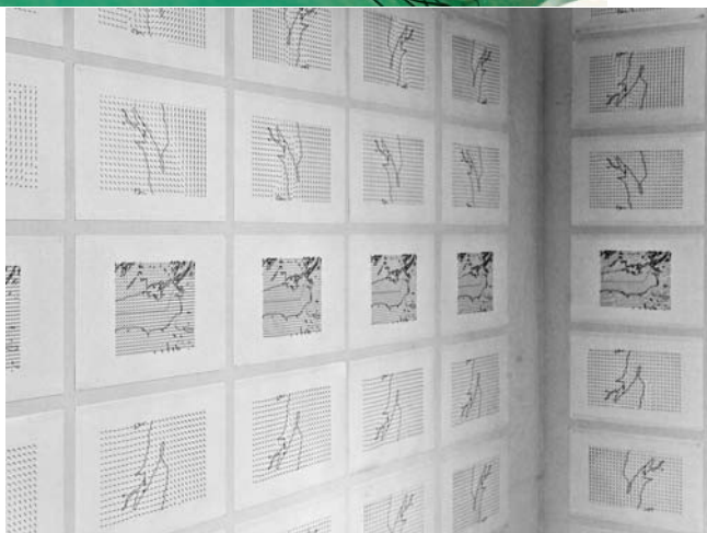
Pierre BOURGAULT, jenesaispasvraimentoujevaismaisjemenvais , 2012. Détails. Nacelle: fibre de verre. 170 x 429 x 218 cm. Moteur électrique, appareil de navigation, diffuseur de sons bathymétriques. Au mur: 457 dessins sur papier Back Lite.