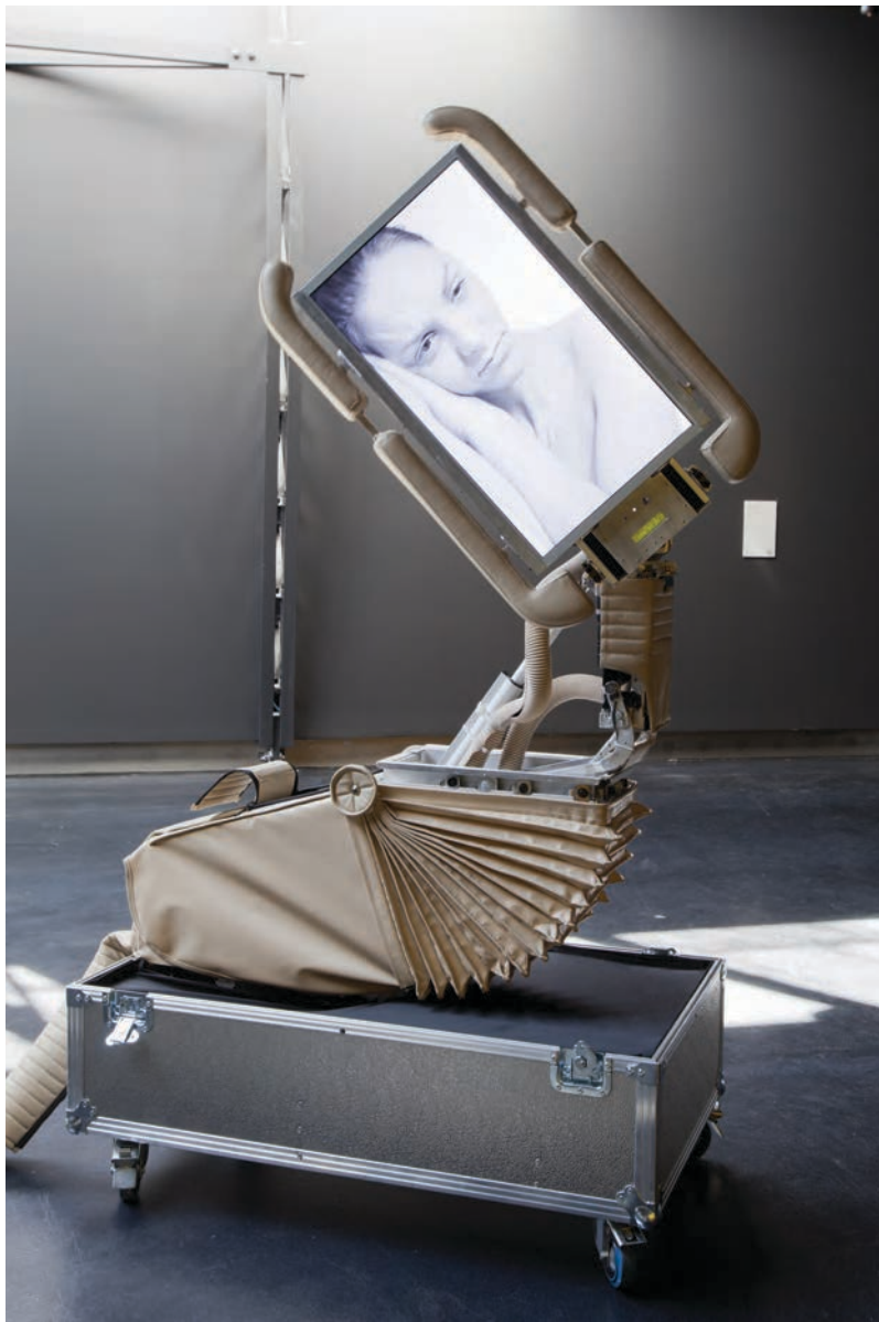
→ Manon LABRECQUE, THE , de la série Les astrophysiques , 2012. Photographie.