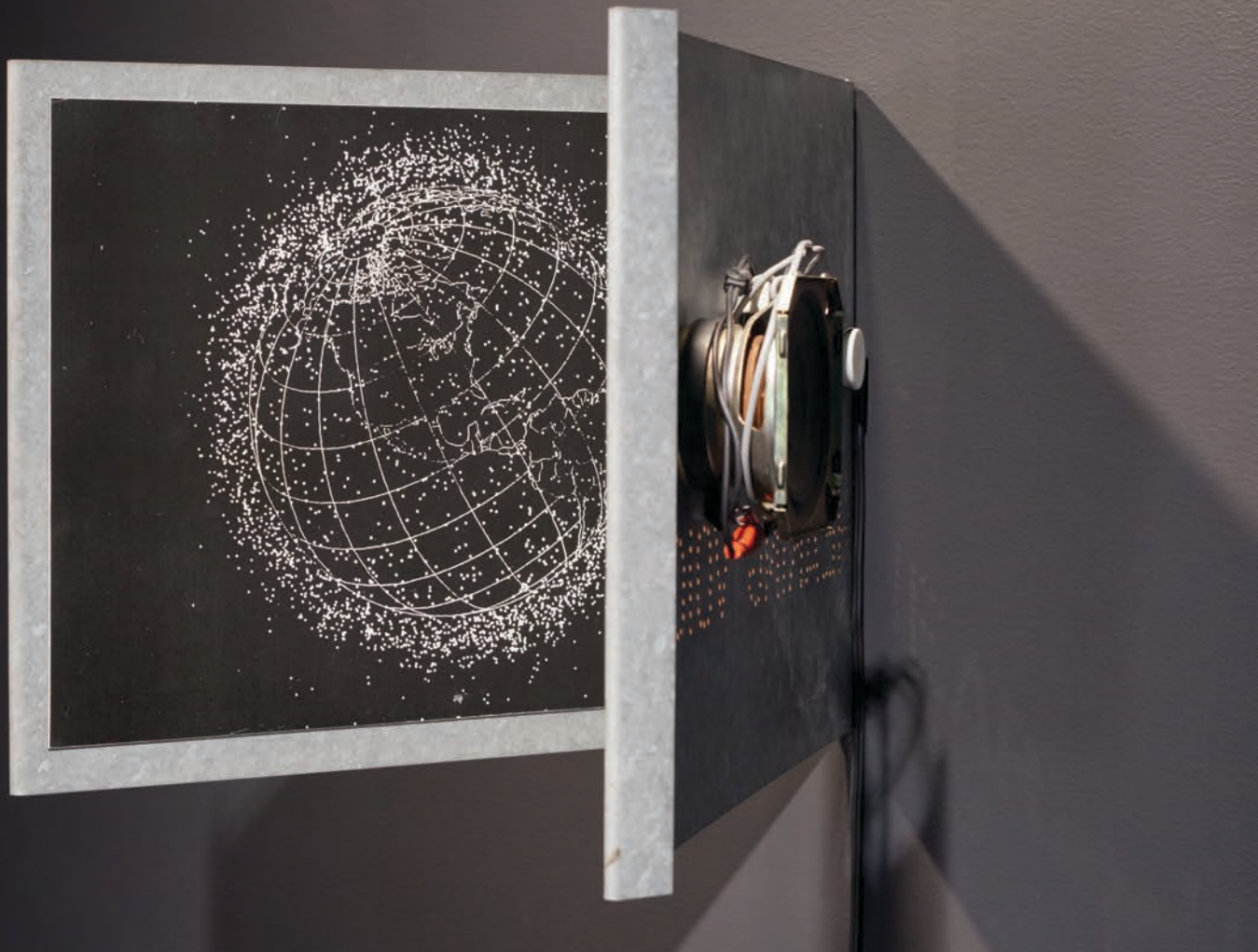
Martin TÉTREULT, Phonographes vinylisés , 2012. Détail de l'installation.