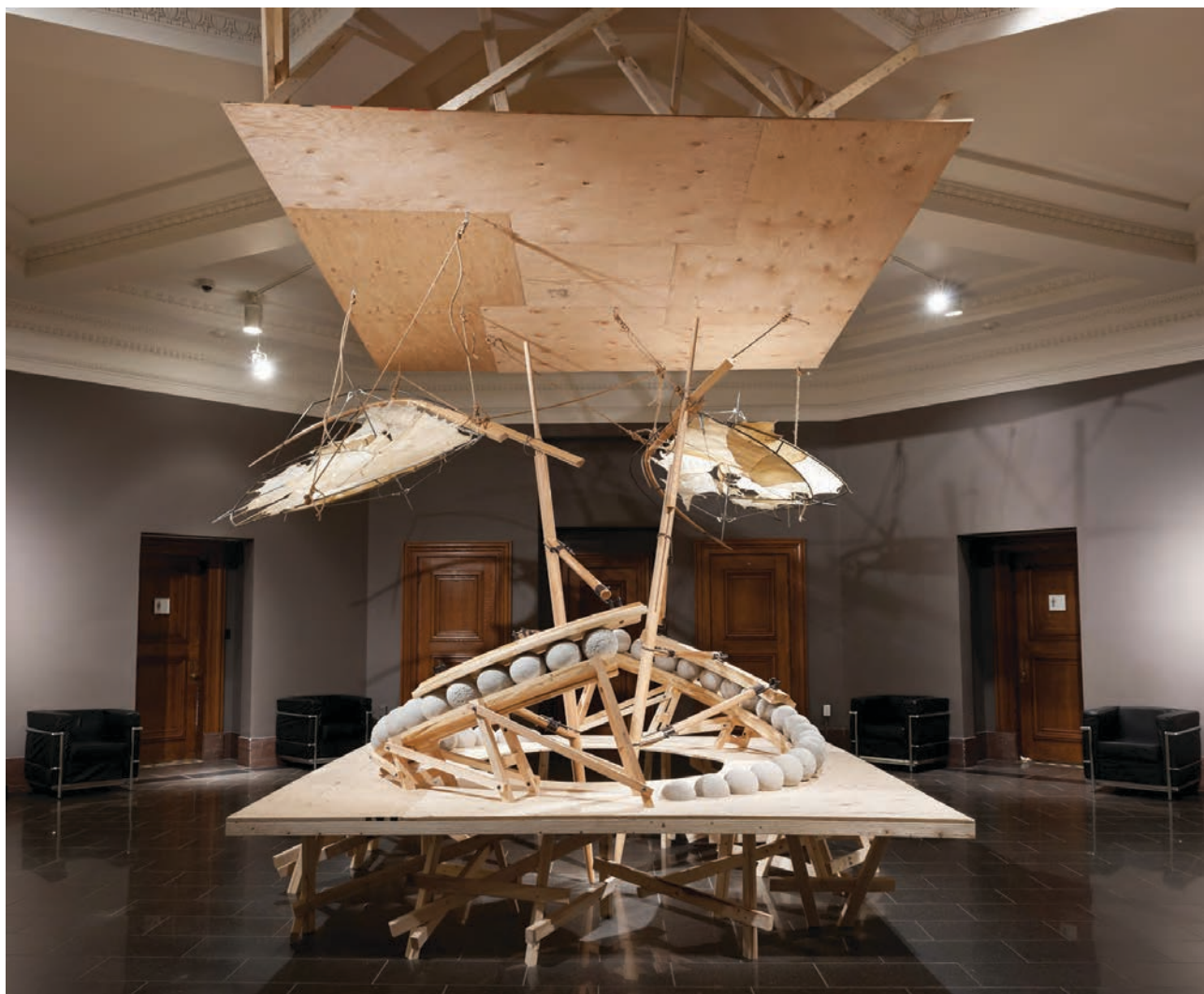
François MATHIEU, De l'air et du plomb , 2012. Sculpture/Installation. Musée national des beaux- arts du Québec.

Avec humour et dans une sorte d'ode à la paresse—ne rêve-t-on pas