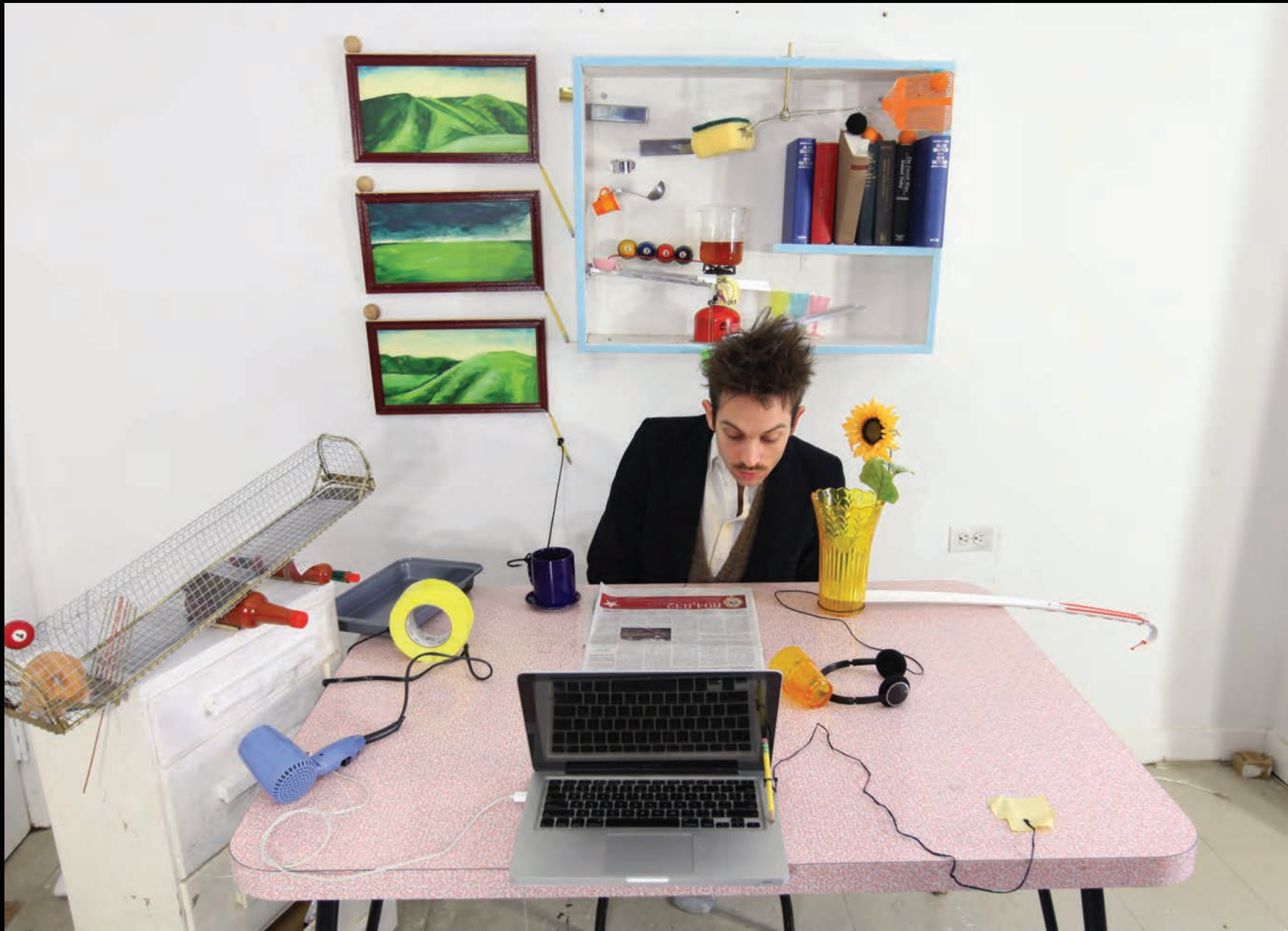
Joseph HERSCHER, extrait de The Page Turner , 2012. Vidéo, couleurs, son, 2 min 8 s.