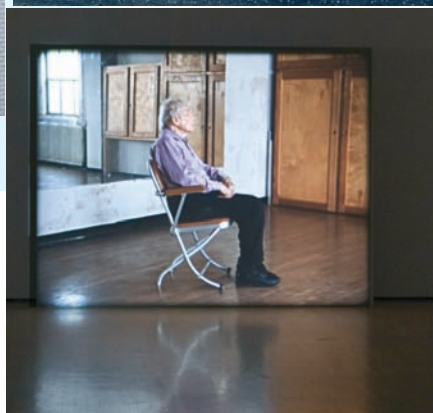
Tacita DEAN, Merce Cunningham performs STILLNESS , 2008. Vue de l'installation/Installation view, Musée d'art contemporain de Montréal.