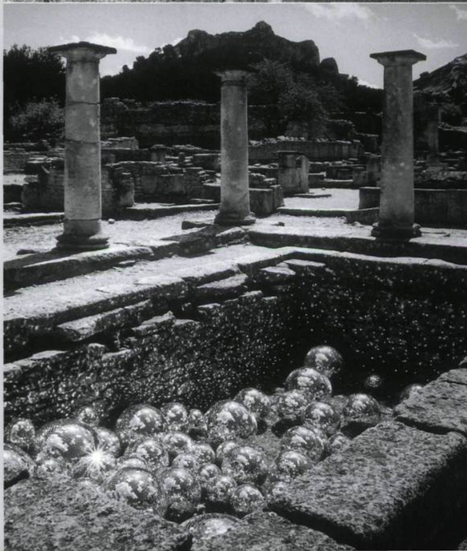
Ange Leccia, Église ode Lumière , 2000. Abbaye de Cluny.