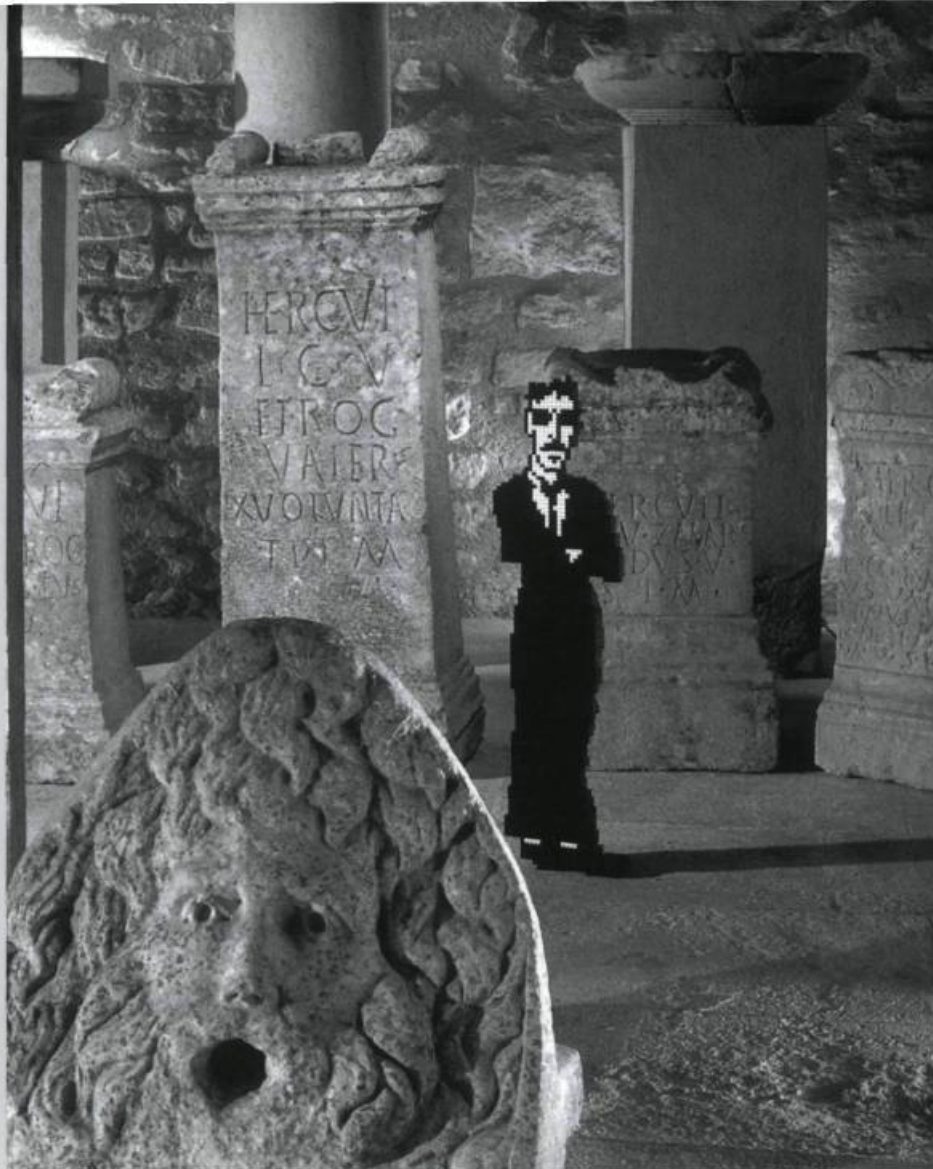
Serge Comte, Attack de Lux , 2000. Glanum.

Au Site archéologique de Glanum, dans le sud de la France, Serge Comte invente une quatrième strate fictive de civilisation à ce lieu