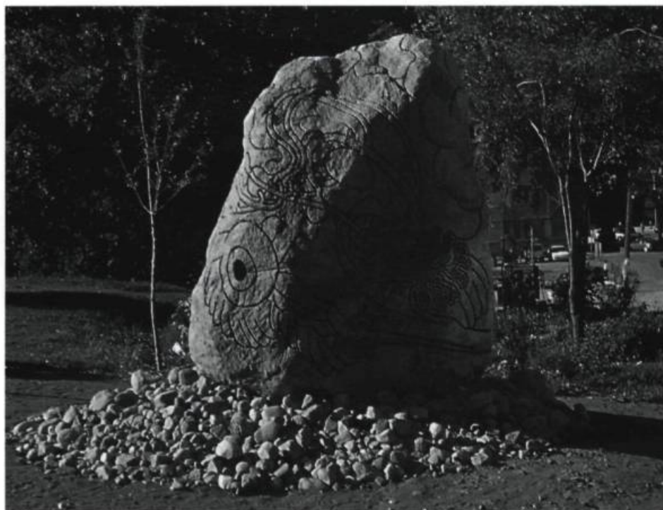
Bill Vazan, Prédateur et système nimbique , 1996. Granite, 2,74 x 2,13 x 1,52 m.

Les textes qui suivent ont trait à deux événements organisés conjointement par Obscure 1 et l'Ilot Fleurie 2 à l'été 1996. Ces événements réunissaient deux des figures de proue de l'art environnemental, Otto Piene , chef de file incontesté du Sky Art , et Bill Vazan , reconnu internationalement pour sa contribution aux pratiques du Land Art . La participation d' Otto Piene comportait deux volets : Ascent , installation extérieure composée d'une série de sculptures gonflables ayant pour but de relier symboliquement Obscure et l'Ilot Fleurie , et Les fleurs du mal , installation intérieure issue de l'agencement de quelques sculptures ayant déjà vogué sous des cieux moins obscurs (notre texte portera sur cette installation). Bill Vazan a pour sa part réalisé in situ, à même une pierre qui demeurera sur place, l'une de ses sculptures "hiérophaniques" 3 .