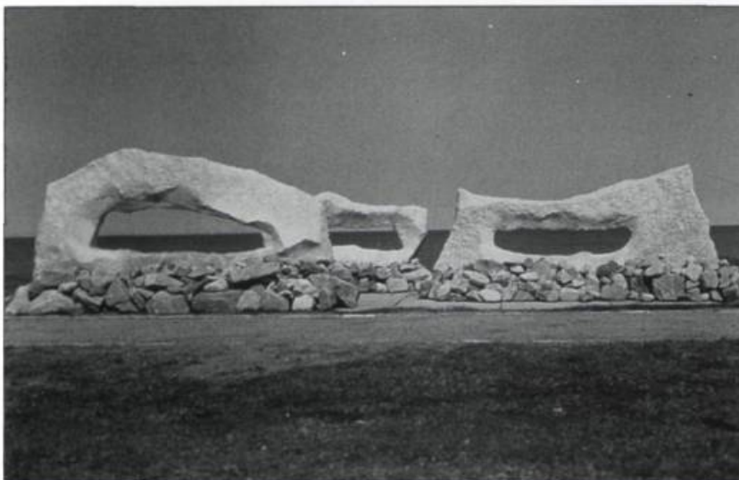
Lourdes Cue, Windows on the Sea , 1986. Granite, water, pebbles. 1,52 x 6,09 x 3,04 m.

walking between the towering and winding trunks.