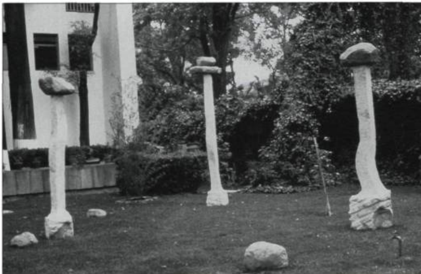
Lourdes Cue, Menhires of the Twentieth Century , 1988. Marble, river, stones. 3,04 x 4,57 x 4,26 m.