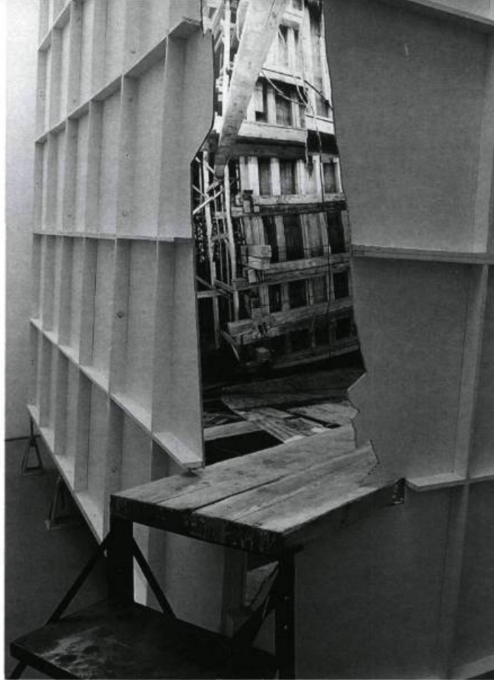
Alain Paiement, Chantier (Building Sight), 1991, 350 x 350 x 350 cm.

vibrer toutes les autres par les questions qu'elles soulevaient, soit l'association entre les instruments de pouvoir et de vision, et la perte du contexte dans notre monde visuel manipulé.