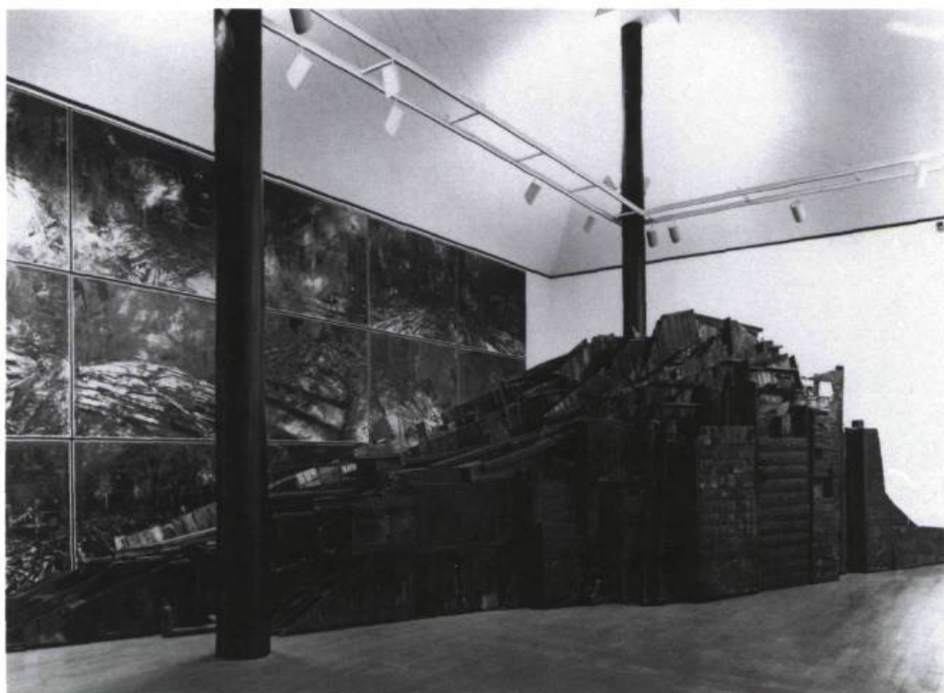
Kazuo Kenmochi, Untitled , 1990. Wood and paint, drawings (oil on photographs). 330 x 1260 x 280 cm.; drawings 498 x 1330 cm. A Primal Spirit: Ten Contemporary Japanese Sculptors . Collection Galerie Tokoro, Tokyo. Los Angeles County Museum of Art.

wise with natural resources. It was only in 1854, when Commodore Matthew C. Perry and the American fleet of Black Ships, with a show of force, convinced Japan to sign diplomatic agreements that led to the opening of Yokohama. Until then Japan had been in a state of splendid isolation for 250 years, perfecting and refining its cultural traditions. Soon after, Japonisme had invaded Europe, the Ukiyo-E (floating world) woodblock prints, textiles