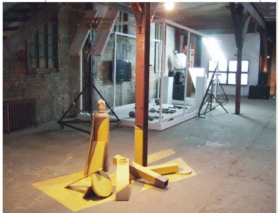
Vue de l'exposition, 2014.

Chantier libre 4 entend redéfinir le champ de la sculpture à partir de cette polysémie de formes. L'ensemble se place sous le règne du multiple et de l'hétéroclite d'où l'objet émerge et vient occuper une place centrale. La prépondérance de l'objet donne une inflexion résolument formaliste à l'exposition : elle se compose au plus près de l'objet et de sa matérialité, où s'expérimentent différentes formes et de nombreuses manipulations. La thématique fixe lui faisant défaut, l'exposition garde nécessairement une approche formelle qui laisse peu de perspective critique.