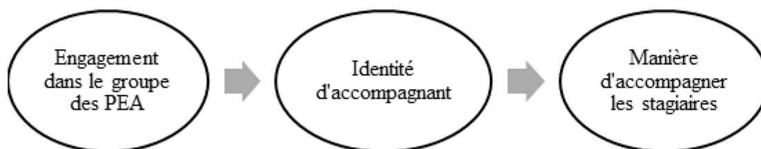
Figure 2. Adaptation de la figure « basic identity theory » de Serpe et Stryker (2011, p. 23).

La perspective explicitée précédemment (Serpe & Stryker, 2011) permet d'illustrer cette dynamique entre l'identité des PEA, leur groupe professionnel et la manière dont elles accompagnent les stagiaires (Figure 2). En résumé, la manière d'accompagner ou les comportements de la PEA constituent la manifestation de son choix de répondre aux attentes qu'elle associe à son rôle. Pour remplir le mandat qui lui est confié, elle doit le connaître, le comprendre et l'intérioriser, or ce rôle semble encore à définir pour s'arrimer au contexte de l'enseignement professionnel. Parallèlement, l'engagement se comprend comme le lien interactif et affectif de la PEA avec ses homologues.