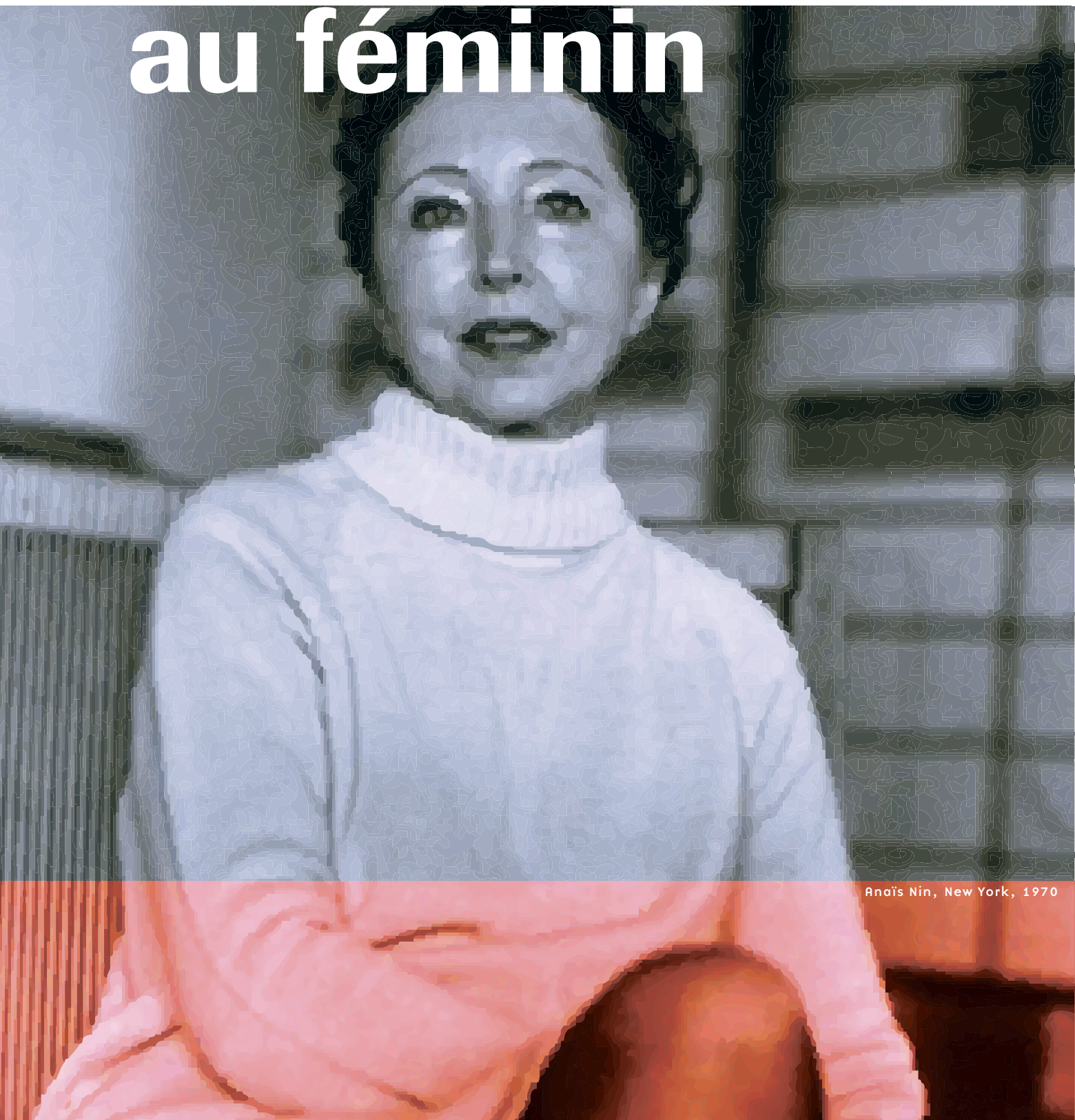
Anaïs Nin, New York, 1970