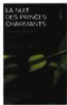
LA NUIT DES PRINCES CHARMANTS Michel Tremblay Babel J, Actes Sud, 2006