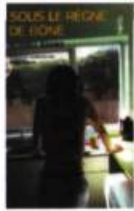
SOUS LE RÈGNE DE BONE Russell Banks Babel J, Actes Sud, 2006

De l'enfance que l'on aimerait ne jamais quitter aux premiers pas timides dans le monde des adultes, la littérature jeunesse foisonne de trouvailles et de surprises qui ne cessent d'étonner et d'éblouir.