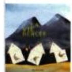
LA VIE BERCEÉE Texte d'Hélène Dorion, illustrations de Janice Nadeau Les 400 coups, 2006