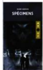
SPÉCIMENS Hervé Gagnon Hurtubise HMH, 2006