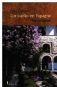
UN JARDIN EN ESPAGNE Katia Canciani Éditions David