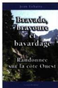
BRAVADE, BRAVOURE ET BAVARDAGE, RANDONNÉE SUR LA CÔTE OUEST Jean Lebatty Éditions La nouvelle plume