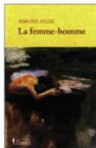
LA FEMME-HOMME Simone Piuze Éditions David