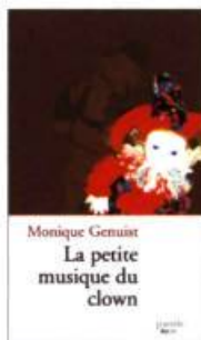
LA PETITE MUSIQUE DU CLOWN Monique Genuist Éditions Prise de parole